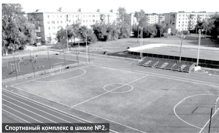
Спортивный комплекс в школе №2.

Модернизация новых спортивных объектов позволила значительно увеличить количество жителей городского округа Богданович, активно занимающихся спортом.