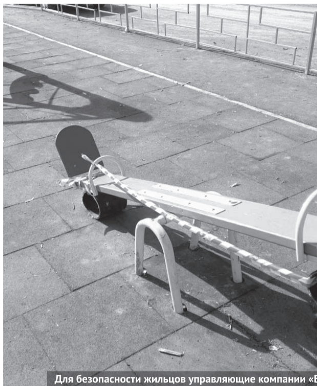
Для безопасности жильцов управляющие компании «Богдановичская» и «Веста» перекрыли доступ к игровым площадкам.