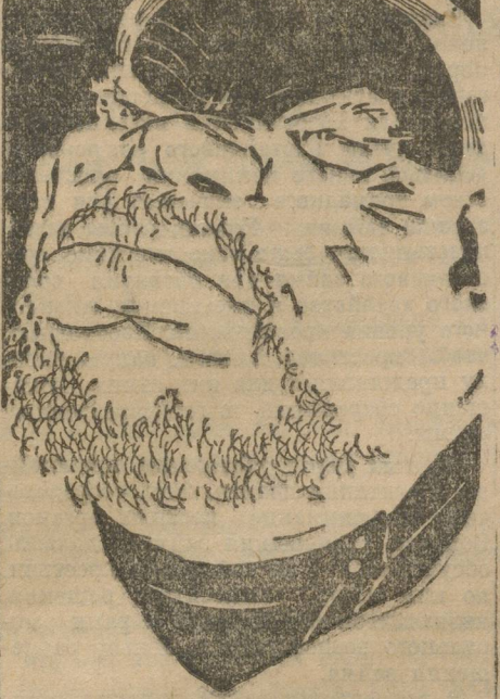
ЛИЦО КЛАССОВОГО ВРАГА.

Результаты такого организованного похода на советские школы и общественность не замедлили сказаться. Много подростков и юношей