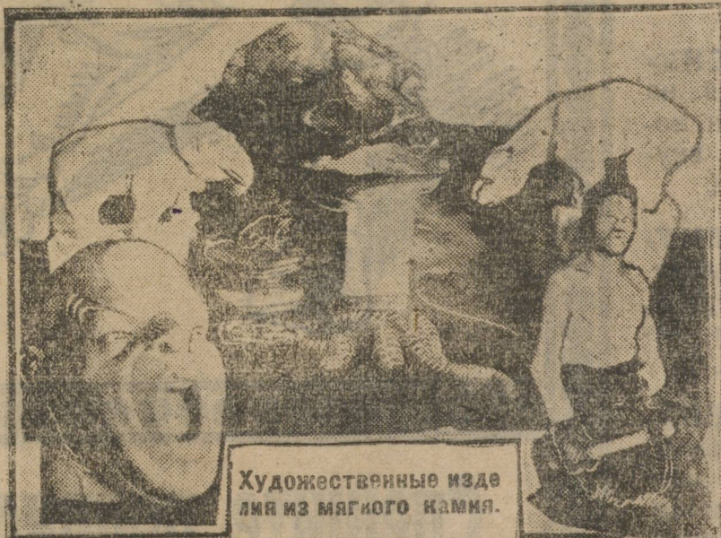
Художественные изделия из мягкого камня.

— Это у нас не все, только начало, — говорят руководители, гордо оглядывая полки мастерской, отягощенные