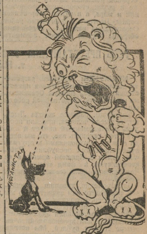
БРИТАНСКИЙ ЛЕВ: Ах, какая она страшная! Ну, прямо не собачка, а русский медведь!

Англия стягивает вооружения к индо-афганской границе под предлогом необходимости обеспечить спокойствие в полосе независимых племен. (Из телеграммы)