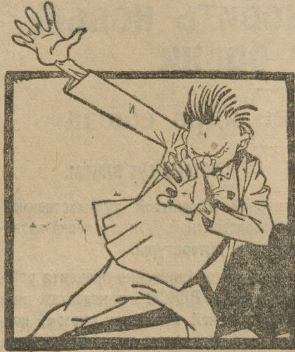
В деревне Сосновый Бор, Бисертского района, органи-

зовался коллектив по совместной обработке земли; в него вошло 4 комсомольца и 3 партияца.