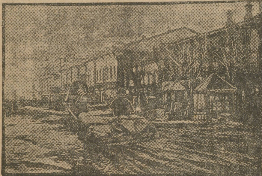
НА САНЯХ НЕ ПРОЕДЕШЬ...