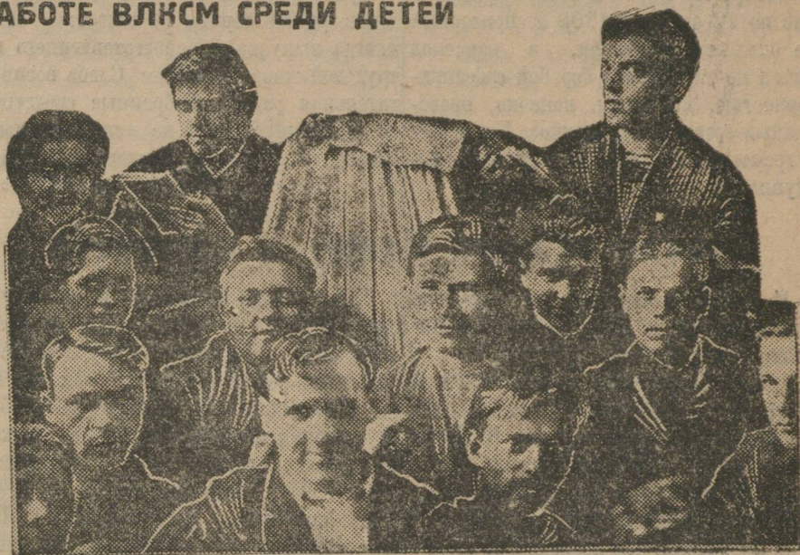
Группа Свердловских делегатов

Надо научить детей любить труд, уважать труд общественный, коллек-