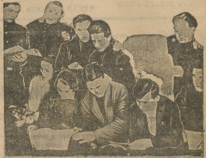
Группа тагильских делегатов