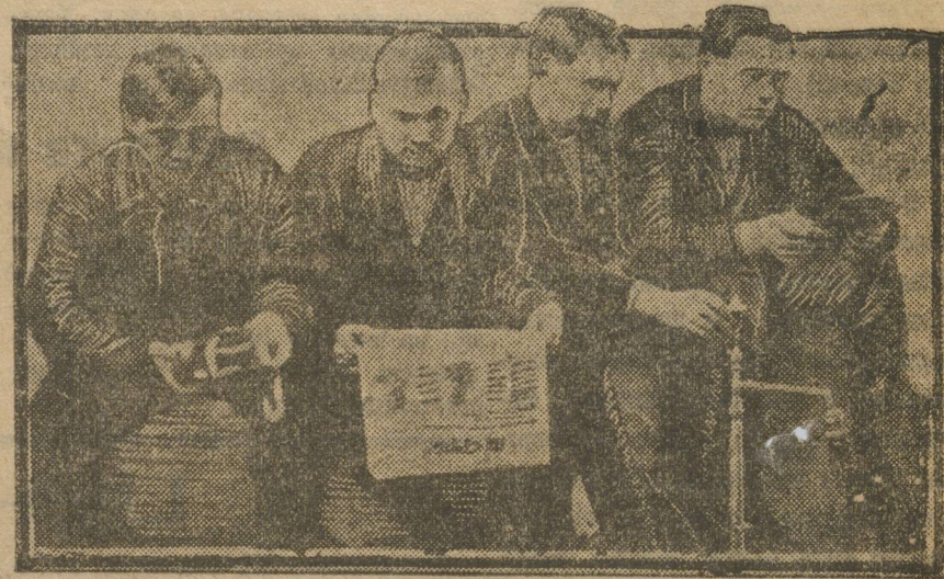
ГРУППА ЧЕЛЯБИНСКИХ ДЕЛЕГАТОВ.

Рассказывает об опыте Лысьвы в проведении кампании проверки выполнения приказа ВСНХ № 277. Особенно зарекомендовали себя во время проведения кампании совещания молодежи по квалификациям, опыт их следует продвинуть на другие заводы. Выпускники школ ФЗУ нами действительно забыты, а создавать их совещания стоит это может дать очень много ценных реладов в производство. Инициативные ударные группы себя также зарекомендовали, но о них мы больше говорим, чем их организовываем.