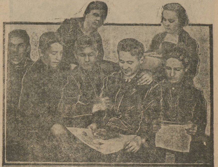
ГРУППА ПЕРМСКИХ ДЕЛЕГАТОВ.

Когда я был на одном из Тагильских заводов, то интересовался, как у нас обстоит дело с переводом из разряда в разряд? По заявлению ребят—дело плохо. Молодежь жаловалась, что на освобожденное место, часто берут со стороны, а не продвигают своих мо-