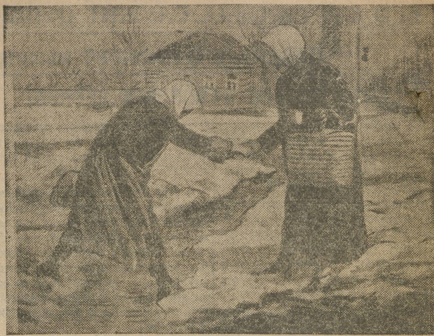
ТАЕТ. На окраинах Свердловска