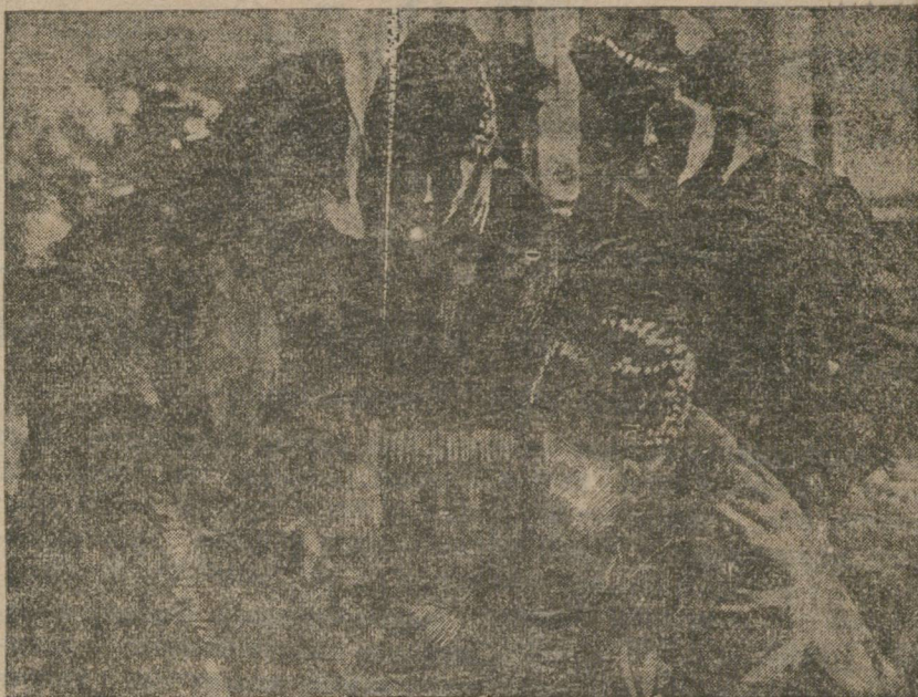
У РЕГИСТРАЦИОННОГО СТОЛА.

А отсюда вывод—надо бросить комсомольские силы на этот участок нашего фронта. Нужно открыть огонь по хулигану-врагу.