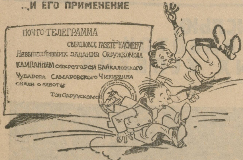
Вниманию некоторых „рабочников“

ПАТЕНТОВАННОЕ СРЕДСТВО... ...И ЕГО ПРИМЕНЕНИЕ