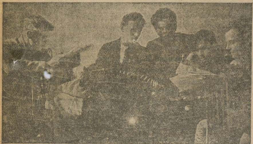
В СВОБОДНЫЙ ЧАС.

Комсомольского экономработника необходимо ввести в цехпрофбюро. Иначе он оторван от возможностей