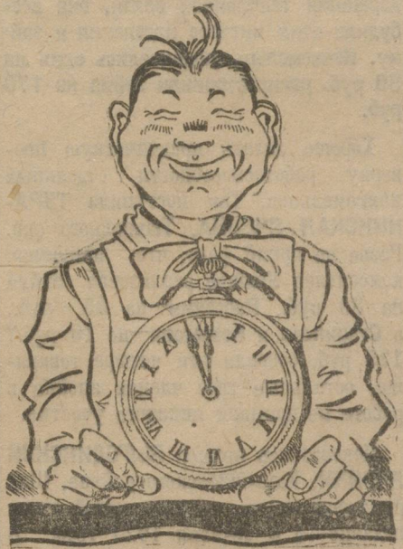
Изобретатель Т. с подарком

Общие собрания молодежи по цехам в большинстве также прошли очень удачно. Например, в штамповальном механическом, отжигательном, жестокатальном молодежи являлась почти на 100% (кроме тех, кто был занят на работе). Пришли даже самые злостные непосетители общих собраний и не только пришли, но и приняли участие в обсуждении доклада заведывающего цехом о работе цеха, о снижении себестоимости, о приказе № 277 и о задачах молодежи.