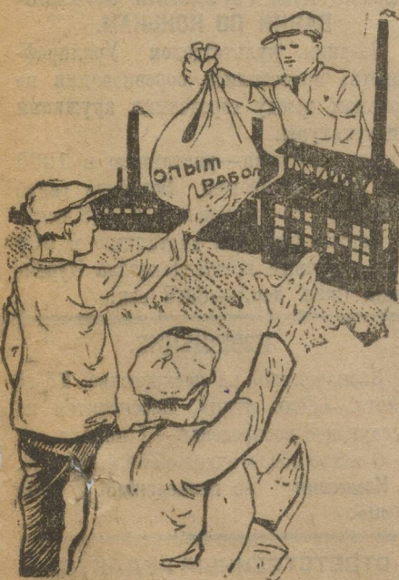
В руки Уральского комсомола.

Лысьвенский комсомол закончил проверку выполнения приказа ВСНХ № 277. По заводу прошла волна совещаний молодежи по квалификациям и цеховых собраний рабочей молодежи. — Проведены две общезаводские производственные конференции. — Вынесены сотни предложений, сэкономлены тысячи рублей денег. — Комсомольцы — изобретатели получили ценные подарки. — К областной конференции Уральского комсомола передаем опыт Лысьвы.