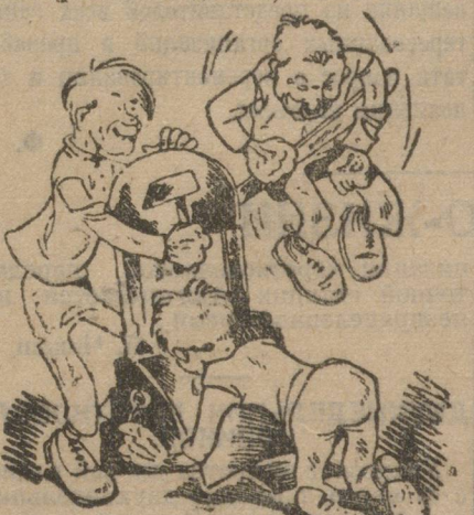
«Работают в поте лица».

поломка большого убытка не принесла (8-10 рублей), но поломка кривошипа, которая могла бы произойти обошлась бы в 120-150 руб. убытка, не говоря уж о том, что 6 человек работающих на станке были бы безработными.