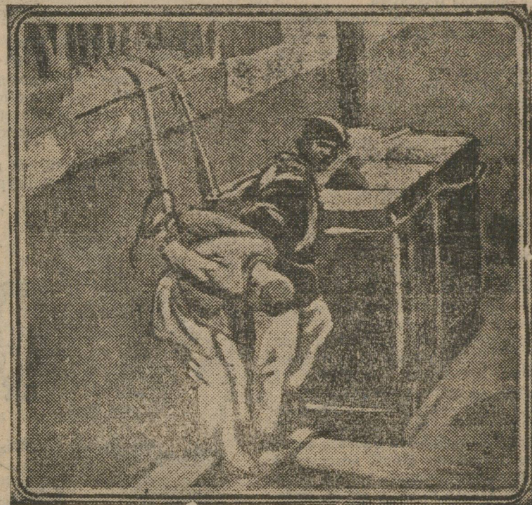
КИТАЙСКИЕ РЕВОЛЮЦИОНЕРЫ ПЕРЕД КАЗНЬЮ.

Большее одной трети подсудимых—молодежь комсомольского возраста. Одиннадцати человекам в момент ареста (21½ года тому назад) не было еще 17 лет.