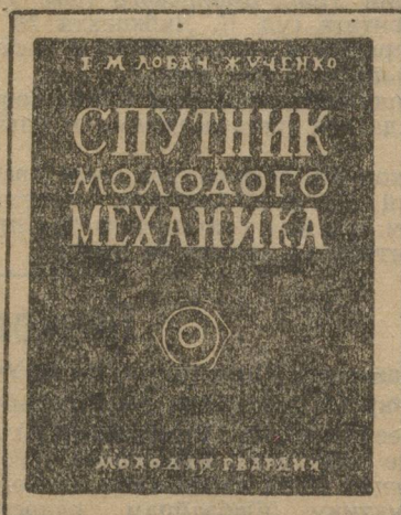
Выпиши эту книгу.

Автор дает довольно неопределенные и отчасти неправильные определения различных понятий и положений механики. Вот пример: определение машины (28 стр.) автор формулирует так: «машиной называется всякое устройство, облегчающее или умножающее труд».