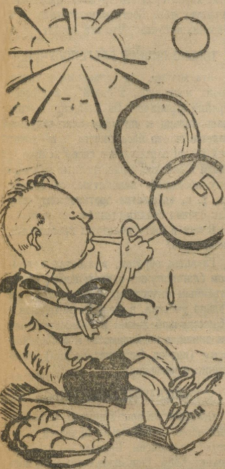
ОТЯД ЗА РАБОТОЙ.

Сейчас пионерорганизация переживает трудный период. Те формы, те содержание работы отрядов, какое существует сейчас, не удовлетворяет запросы детей. Они не хотят работать в организации. Нужен перелом.