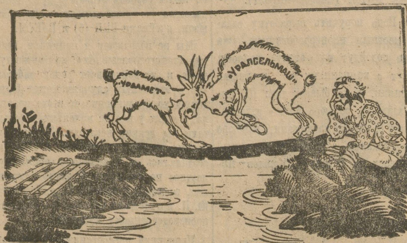
«Паны» дерутся, у хлопцев чубы трясутся!

— А нам какое дело? Ежели нам такое производство невыгодно! Не нам железа, сказано, не приставай, — ругнул Миньяр.