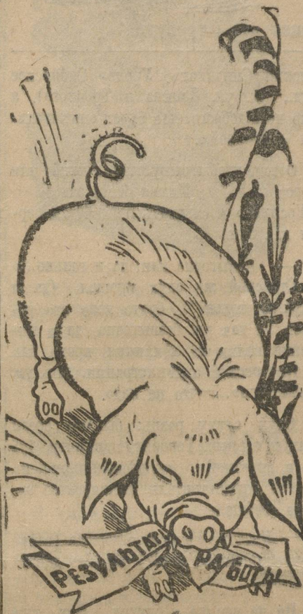
А РЕЗУЛЬТАТЫ СВИНЬИ С'ЕЛИ.

— Надо поручить выработку заданий местным пионерработникам. Они лучше подойдут к этому вопросу, увидят с кампаниями и местными условиями. А то бывает так: ЦБ пишет задания, облбюро пишет задания, окрбюро со своими заданиями, райбюро — тоже задания, а вожатый, не читая, пришивает их к делу. (Каржев — Иrbит).