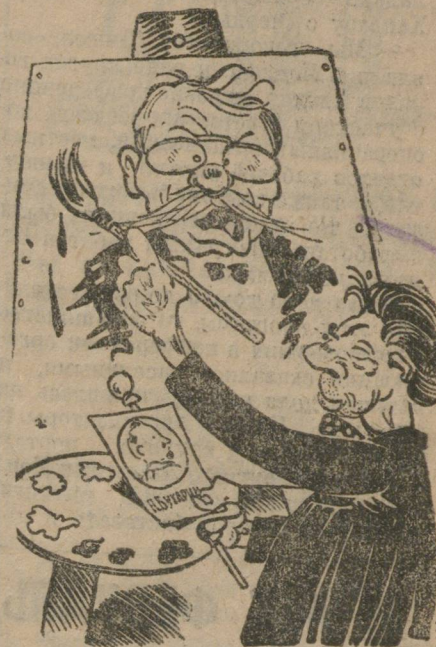
Делал под Николая Ивановича (Бухарина), а вышел Павел Николаевич (Миллюков).