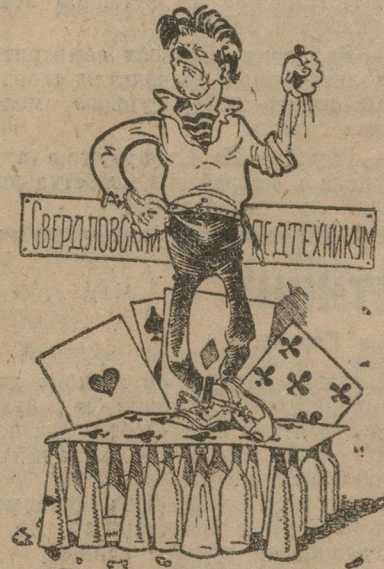
Его идеологическая платформа.