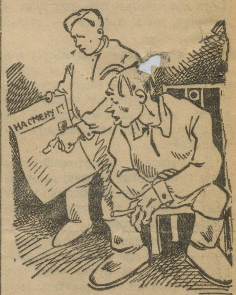
Комсомолец (показывая секретарю Княсовского райкома) Что, брат? Протит фактов не попрешь!

Вот еще несколько характерных, имеющих огромное значение фактов: «Секретарь Висерте, ячейки выступил на сходе против самообложения и в ячейке отказался проводить это мероприятие».