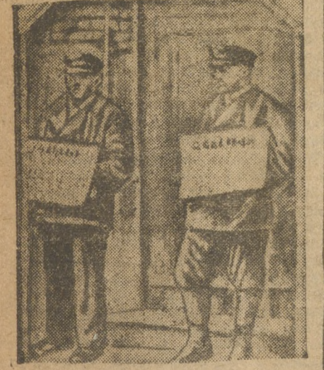
Рур. Пикеты забастовщиков.

Правительственные войска переходят на сторону Красной армии ШАНХАЙ, 27. В провинции Хубей произошел ряд бунтов среди правительственных отрядов, посланных на борьбу с красными. В городе Синьчжоу взбунтовалась одна бригада, которая соединилась с местной милицией и разоружила 4.000 солдат. Восставшие влились в красноармейские отряды. Против восставших посланы войска, которые, однако, не решаются выступить. Кроме того, взбунтовались армейские дивизии в Сициане. В Нанчан прибыла недавно приобретенная у англичан партия винто-