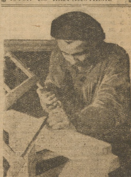
В школе ФЭС Монетки. За оборудованием мастерской

СЛАМА УЧАЩИХСЯ ОБУЧАЮТСЯ 150 НЕГРАМОТНЫХ.