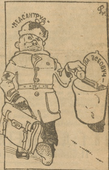
...И пять рублей он школе отвалил.

Комсомольским, профессиональным и общественным организациям Б.-Сос- новского района нужно взять пример с колхозов района, практически помо- гающих школе. Колхозники.