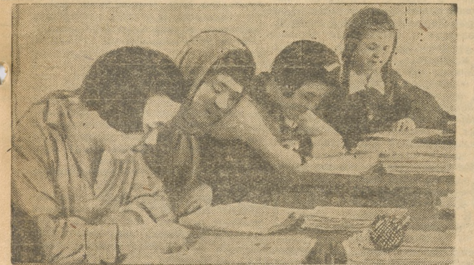
Златоуст. ФЗС. Нацмен на занятиях.

На 31 год планом предусмотрено изготовление 212.400 пар сапог и 135.000 пар ботинок для школьного возраста. Эти цифры нашей потреб-