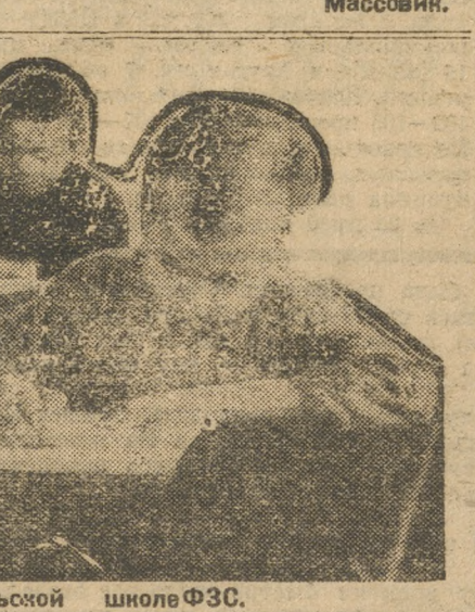
На занятиях в Арамильской школе ФЭС.

«Завод „Смычка“ ждет выпуск о том, что он шагает над школами», так заявляют хозяйственники «Смычки».