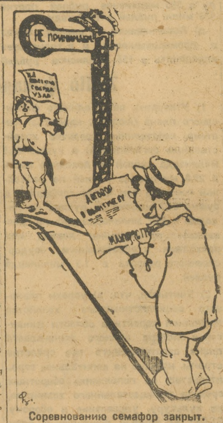
Соревнованию семафор закрыт.

Коллективам узла нужно немедленно исправить свою ошибку, дать по заслугам комсомольскому бюро Уралмашиностроя. Ашихмин.