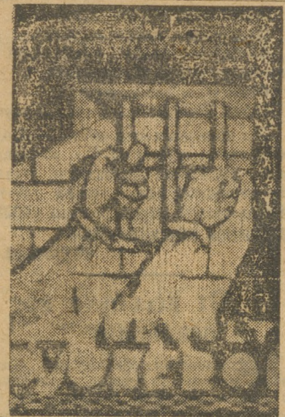
Агит-оратор французской компартии об ужасах капиталистической тюрьмы.

БЕРЛИН, 23. В Эссене (Рурская область) состоялась созванная международным комитетом горняков Профинтерна международная конференция горняков. На конференции были сделаны отчеты представителями революционных горняков Германии, Франции и Чехословакии. После обсуждения ряда вопросов на специальных комиссиях, конференция приняла чрезвычайно важные для дальнейшего развития революционного движения горнорабочих во всем мире, решения.