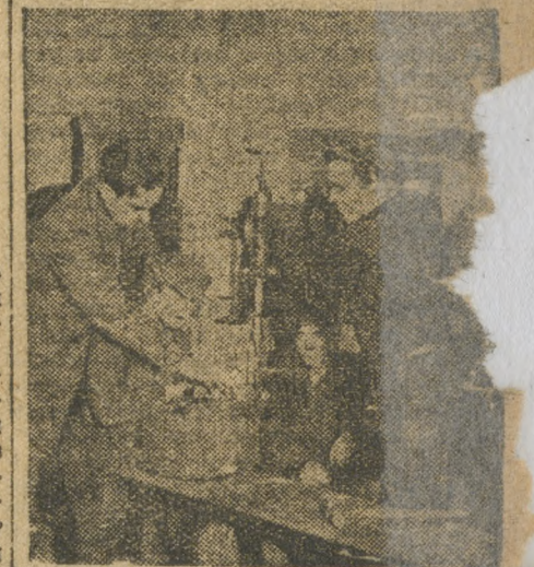
Учеба у сверлильного станка (депо ст. Свердловск).

Лица виновных в создавшемся положении, надо привлечь к партийной и судебной ответственности, чтобы другим неповадно было заниматься оппортунизмом.