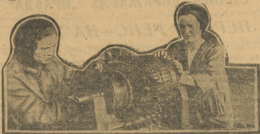
ВИЗ. Школа ШУМПА. Курсантин-комсомолки за изучением обмотки коллентора мотора.

Комсомольская организация Кыштыма ничего не делает по введению в районе всеобуча. Несмотря на неоднократные постановления бюро райкома по этому вопросу, ячейки всеобучем заниматься не желают. Секретарь механической ячейки Власов заявил: «У меня в ячейке нет культурмейцев и от всеобуча нас освободите».