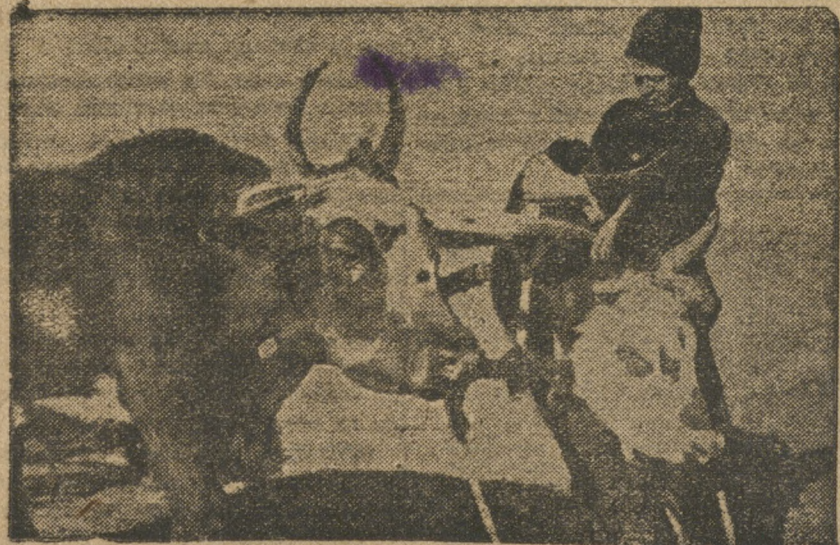
Важнейший партийно-хозяйственный совещание

4) Поручить Наркомснабу и Наркомзему СССР принять меры для обеспечения полной загрузки сырьем старых и вновь строящихся консервных заводов по переработке овощей, значительно удлинить на этих предприятиях уже в этом году сезон производства против истинного года.