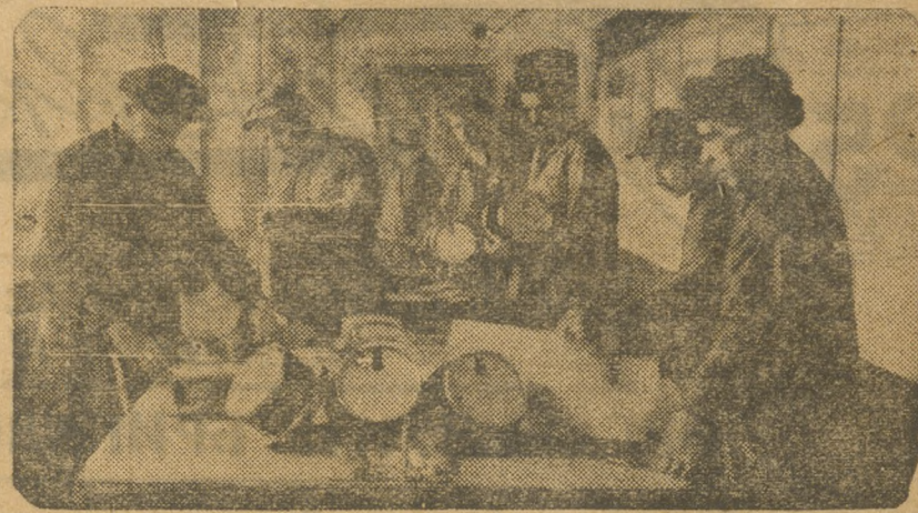
Златоуст. Комсомольская бригада элекриков.