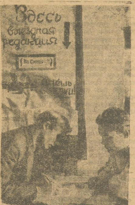
Юнкор Юговского района беседует с представителем выездной «На Смену» на конференции.