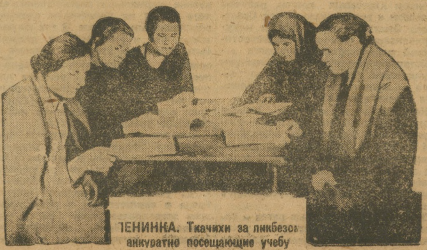
ТЕНИНКА. Ткачихи за ликбезом активно посещающие учебу