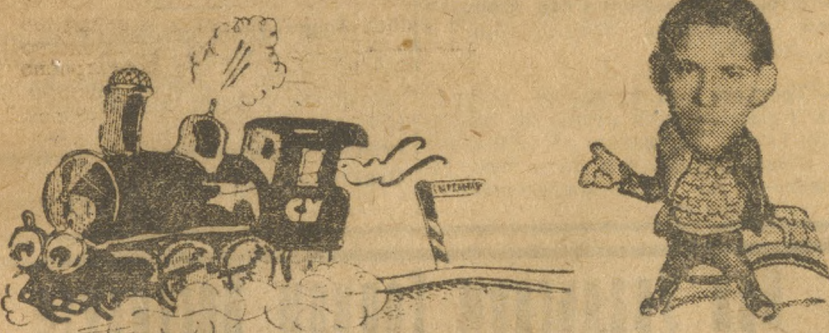
«Наш паровоз летит вперед... В Свердловск не заарнет».

Пермская делегация обязалась приехать на паровозе, сделанном сверх плана.