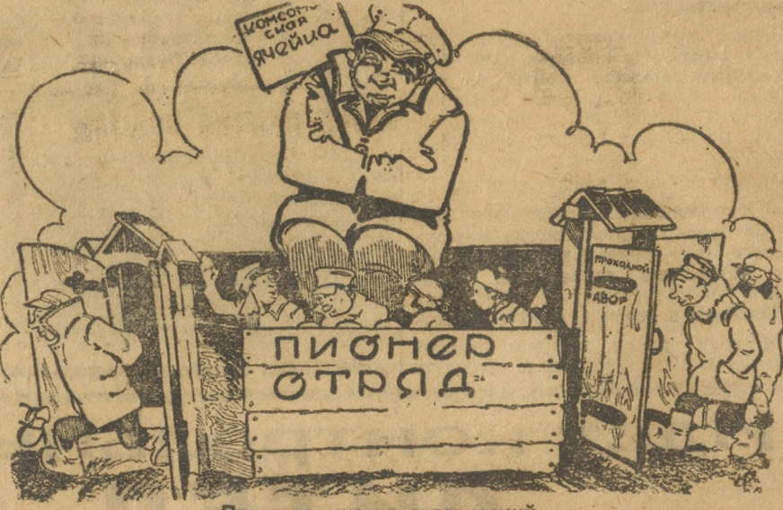
Практика многих организаций.