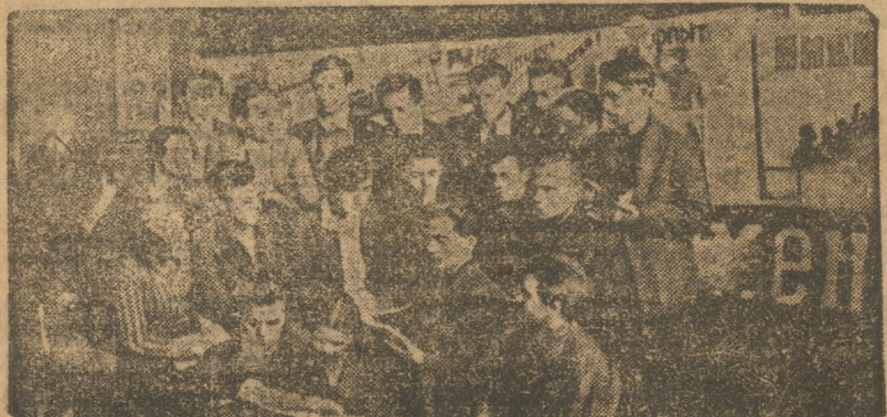
Делегация 1-го района Свердловска.

Делегаты после конференции поехали на вечера рабочей молодежи на Уралмашинстрой. Мочетку, 178 поля и на ВИЗ.