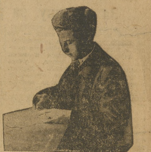
Вологуж — делегат-колхозник. ТЕЛЕГРАММЫ

Полития газовыми бомбами, вызывающими слезотечение, пыталась разогнать забастовщиков. 35 забастовщиков арестовано.