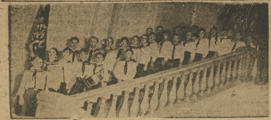
Делегацию приветствовала смена...

Я думаю, что уральская организация комсомола и впредь будет боевой крепкой надежной организацией партии и союза. Я уверен, что уральский комсомол после конференции пойдет по пути дальнейших побед на всех фронтах социалистического строительства. Эти победы будут достигнуты под руководством большевистской партии в беспощадной борьбе с оппортунистами из правого и «левого» лагеря. Под боевыми знаменами ленинской партии-победительницы мы пойдем стальными непоколебимыми рядами на стройку Большого социалистического Урала. (Бурные продолжительные аплодисменты).