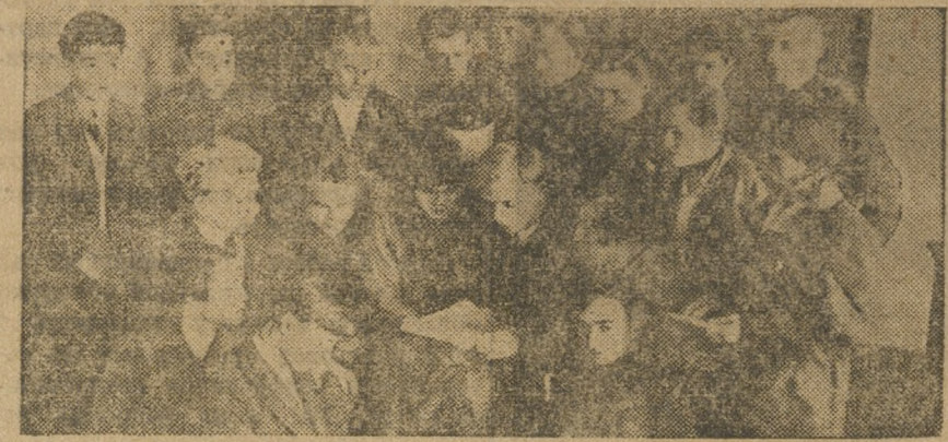
Златоустовцы на конференции.

Для того, чтобы успешно разрешить поставленные перед союзом задачи со стороны партии, чтобы успешно разрешить вопросы еще большего участия комсомола в производстве, надо уметь впитывать новые широкие слои массы рабочей молодежи в союз, надо организовать эту массу молодежи вокруг союза, из этой массы молодежи ковать новые кадры для социалистического строительства. Вести культурно-массовую работу нужно не только в клубе. А многие товарищи этого не понимают, заваливая: «Какая у нас массовая работа, когда клуб всего на 200 человек, где мы будем массовую работу развертывать?»