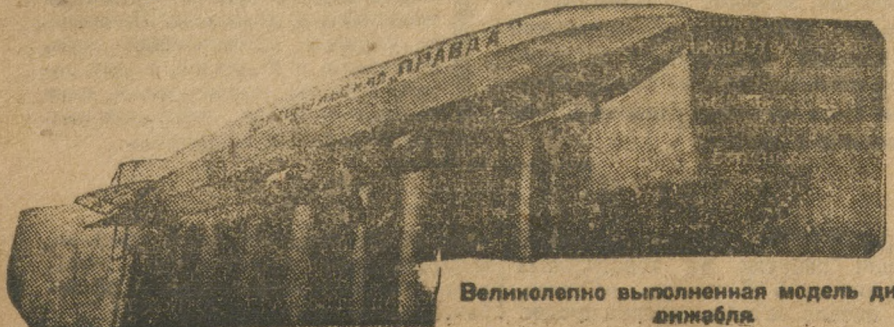
Великолепно выполненная модель ди-анавла