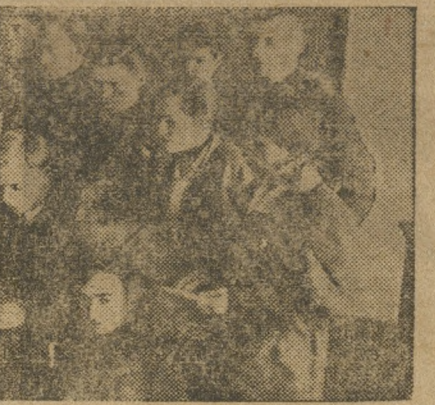
Златоустовцы на конференции.

Тюменский и Ишимский округа даже между собой заключили социалистический договор, что к 1-V—30 г.