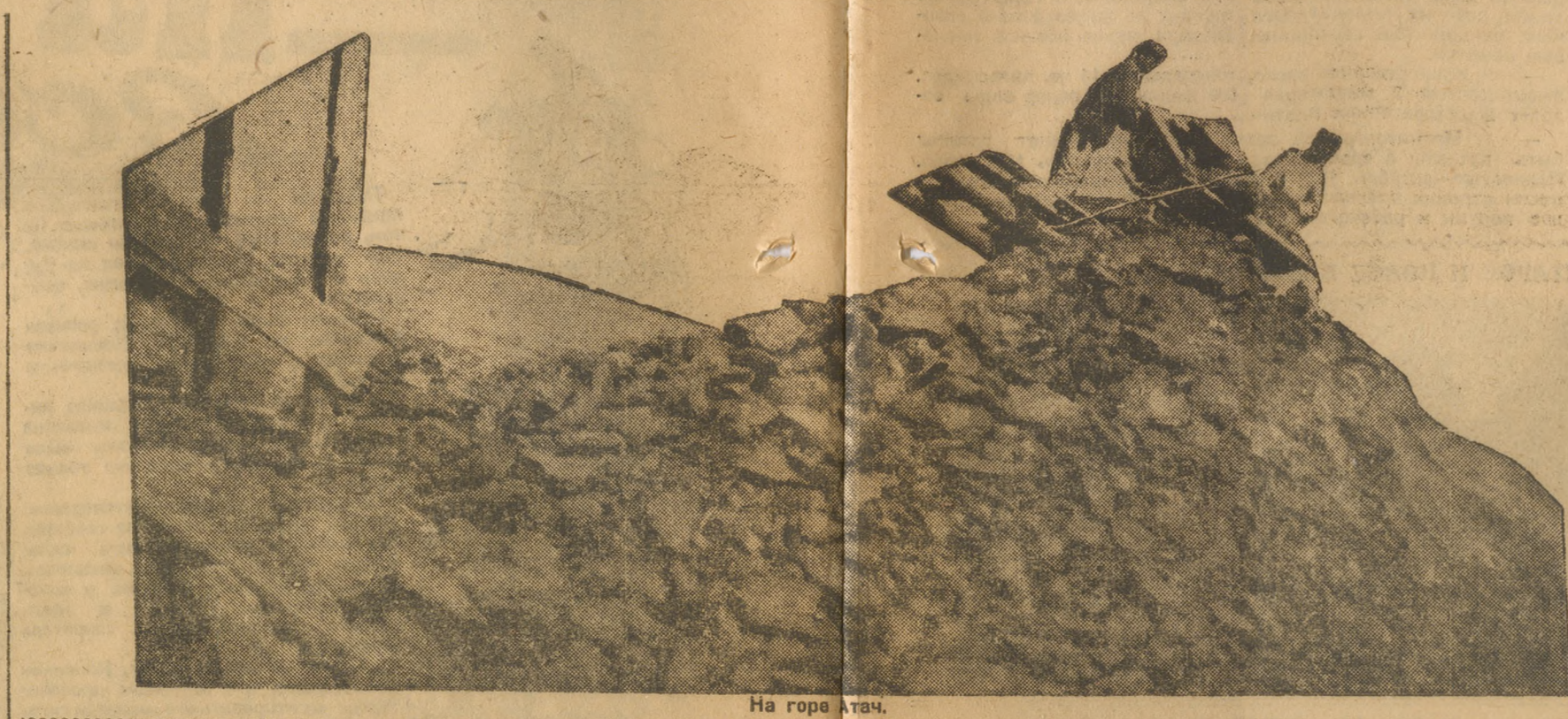
На горе Атач.