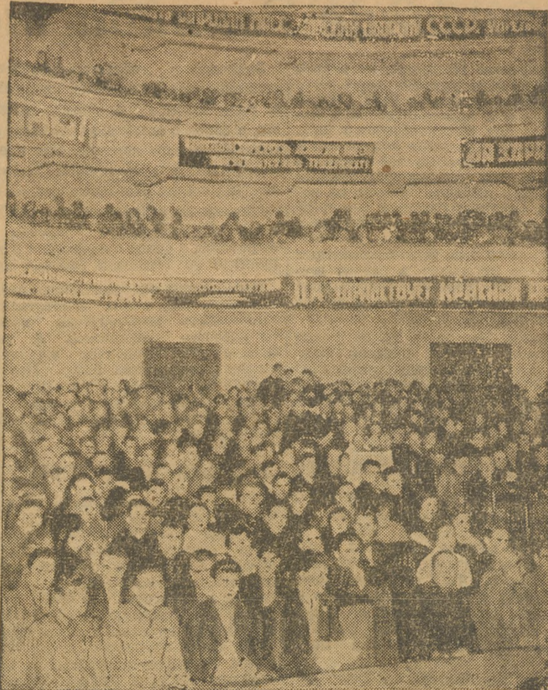
Ожил, заплестел плакатами и лозунгами театр Луначарского 8 декабря.