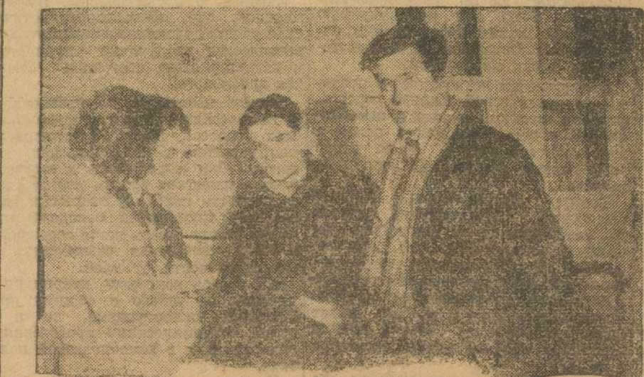
Делегация французского комсомола.

Я приведу несколько данных. Вот зам рост подросков в промышленности. На первом в марте 28 года подросков в промышленности имелось 123 тысяч. На первое октября 29 года подросков