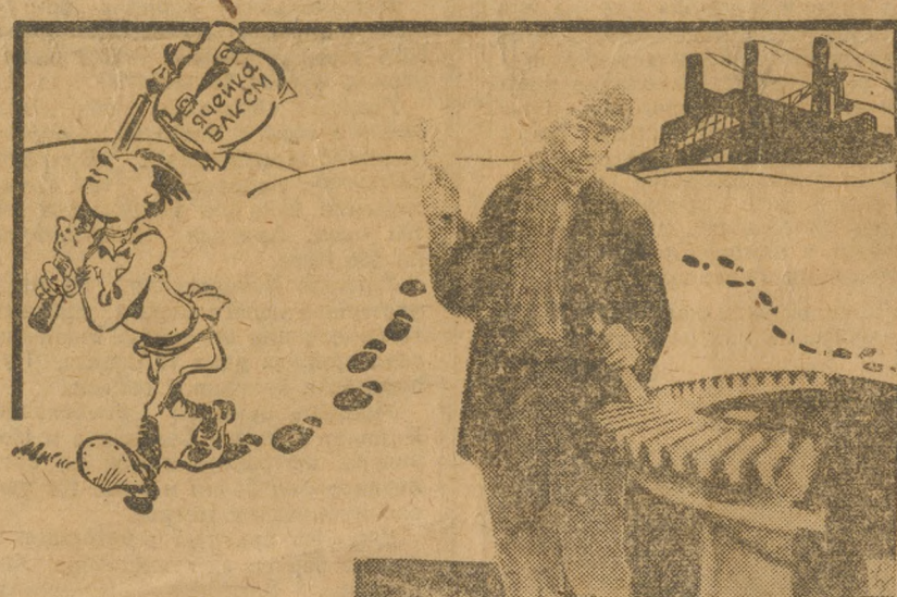
... Проща, обошла стороной.