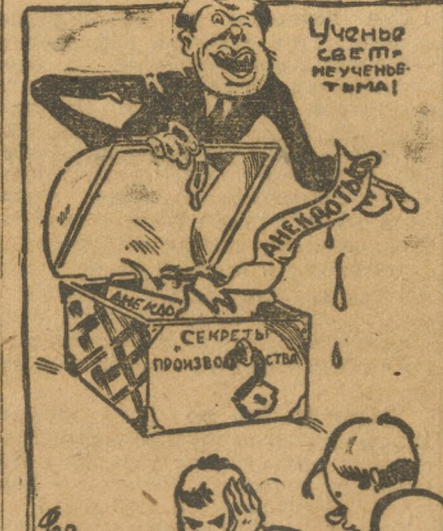
«Секреты производства» педагогов ФЗУ ВИЗ'а.