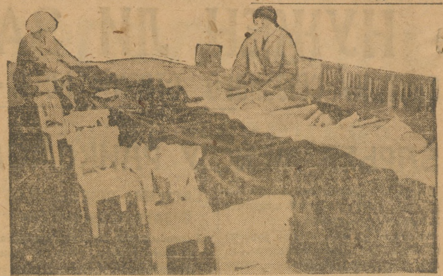
Детские ясли жанта им. Парижской коммуны. Мертвый час.

— Курсы земельных регистраторов и ефцижиков открываются в Свердловске.