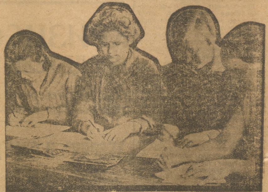
СВЕРДЛОВСК. В ФЗУ Ленинки.