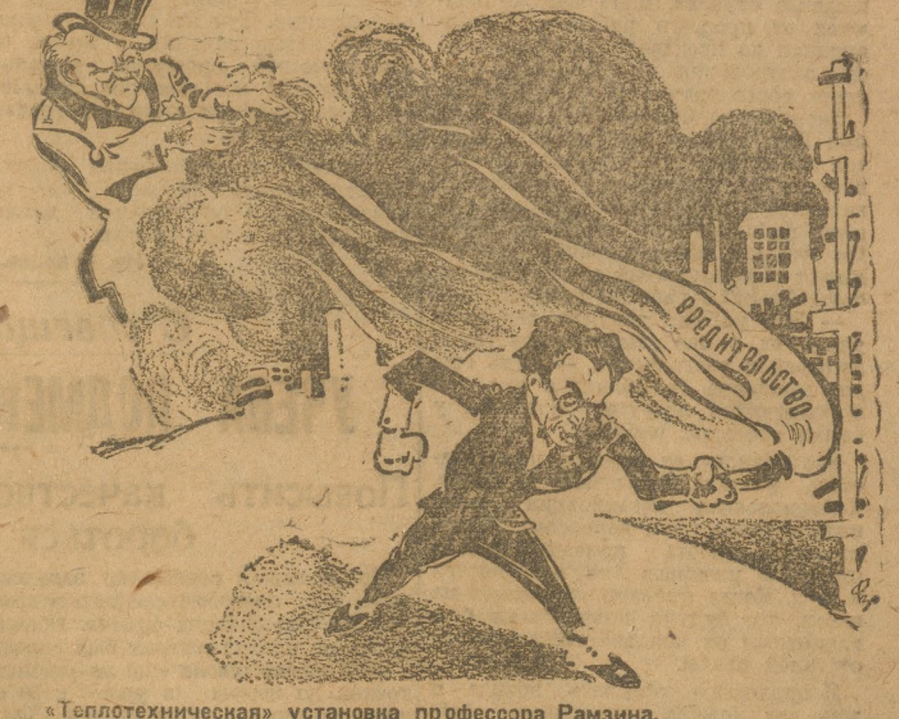
«Теплотехническая» установка профессора Рамзина.