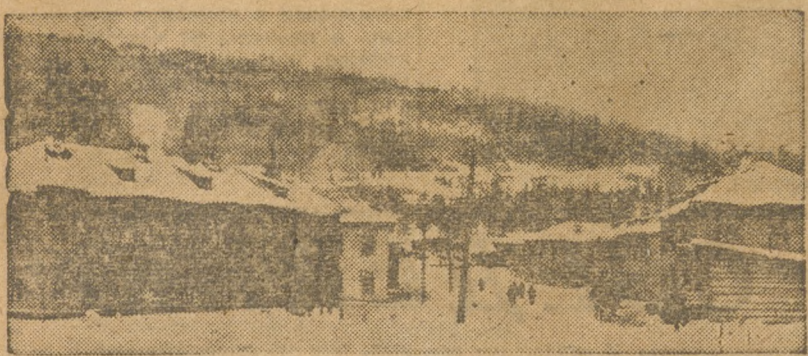
ГУБАХА. Рабочий поселок.