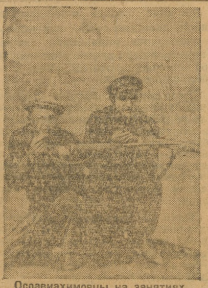
Осоавиахимовцы на занятиях.

О декаде обороны в районе знают только по наслышке... Др.