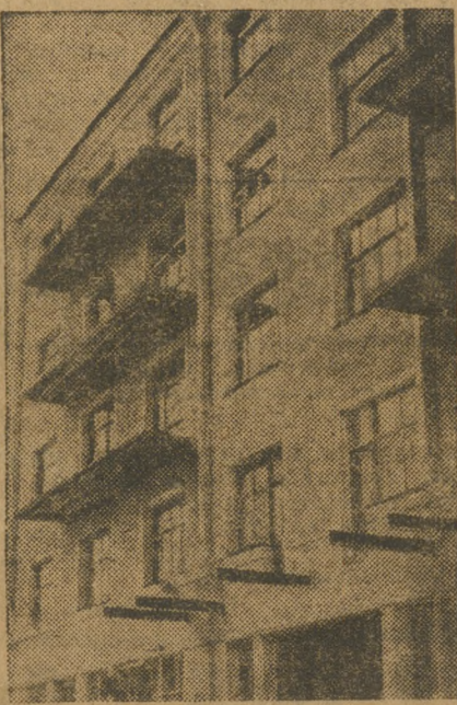
Новый дом Горсовета № 5 по ул. Вайнера. Часть дома уже заселяется.