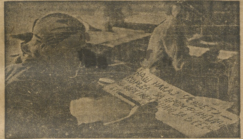
Школа в селе Белоярском. Пишет наиз сельсовету.