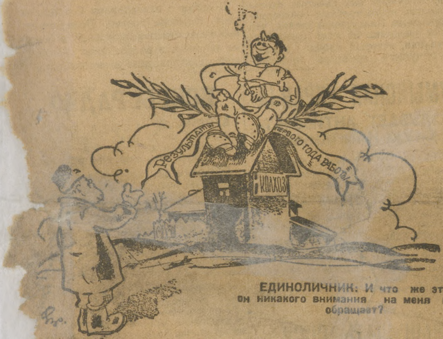
ЕДИНОЛИЧНИК. И что же это он никакого внимания на меня не обращает?