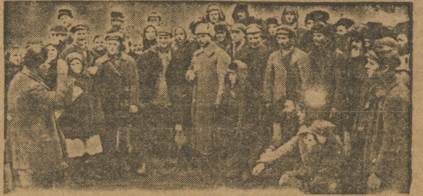
Агитаторы за колхозы в деревне Медведево, Щучанского района.