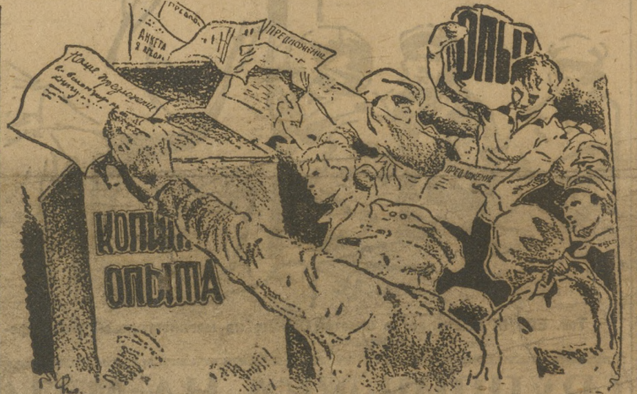
Кто куда? А я в «беркасу»... опыта!

Перенимайте опыт пермяков и надеждинцев, организуйте сбор предложений, обсуждайте их на собраниях, проводите в жизнь. Выходите на трибуну опыта, через «На Смену» рассказывайте, как вы работаете.