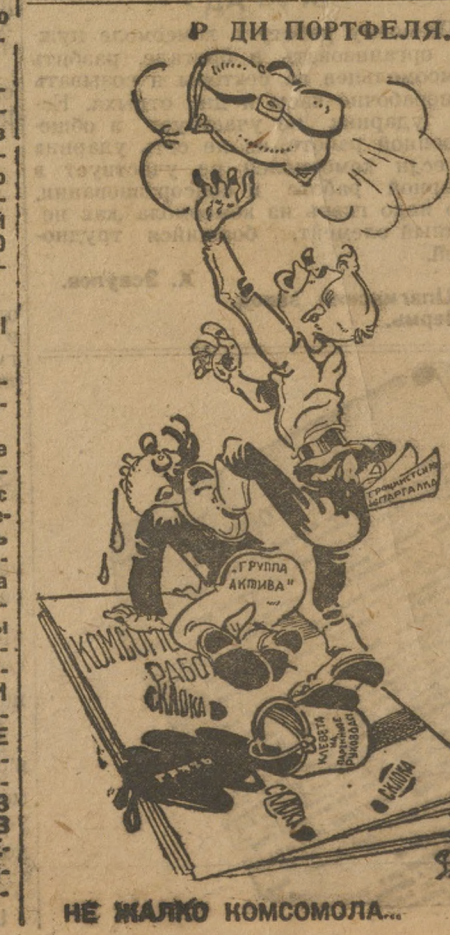
НЕ ЖАЛКО КОМСОМОЛА...