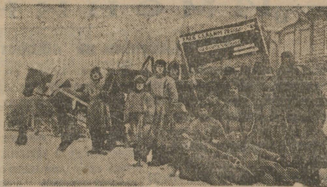
Красный обелиск в Воткинском заводе, Сарапульского округа