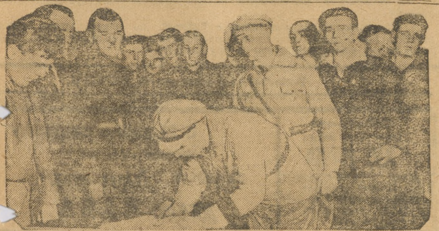
На вечере посвященном «декаде обороны».

ПОСТАНОВИЛО: ОТЧИСЛИТЬ В ФОНД ОБОРОНЫ ОДНОДНЕВНЫЙ ЗАРАБОТОК, ЧТО СОСТАВЛЯЕТ СУММУ 500 РУБЛЕЙ И ВЫЗЫВАЕТ ГОРЖИЛСОЮЗЫ, НАКЛЫ И РЖОКТ ГОРОДА СВЕРДЛОВСКОГО И УРАЛОБЛАСТИ ПОСЛЕДОВАТЬ ЭТОМУ ЖЕ ПРИМЕРУ.