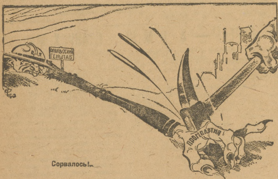
РИС. В. ФОМИЧЕВА

Вчера в Москве специальное присутствие Верховного суда начало слушанием дело контрреволюционной организации «промышленная партия».