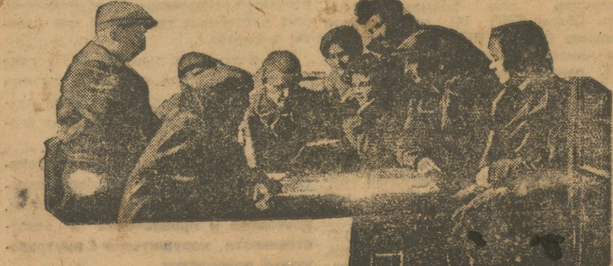
Златоуст. Комсомольский штаб по ликвидации прорыва.