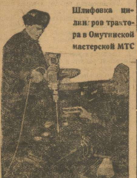
Шлифовка цилиндров трактора в Омутинской мастерской МТС

Вся работа колхозных ячеек должна быть пропитана и тесно увязана с кругом хозяйственных и политических вопросов жизни колхоза. Быть первым из первых, проводить в работе четкую классовую линию, в духе решений партии—вот краткая характеристика задач колхозных ячеек комсомола на ближайший период.