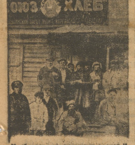
Хлебодачники получают расчет и квитанции в конторе Макушевского «Союзхлеба».

Только эти условия могут быть выполнены для Урала.