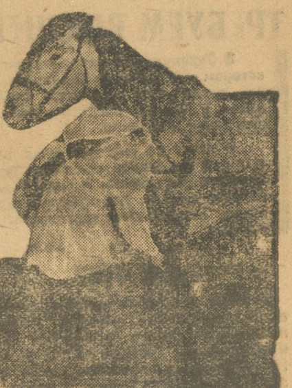
Дадим новые тысячи специалистов социалистической деревне.

Органам Наркомтруда по решению ЦК ВКП(б) должны были совместно с Наркомземом в 2-месячный срок провести учет всех специалистов-животноводов и ветеринарных врачей с тем, чтобы все работающие не по специальности были переброшены на укрепление животноводческих организаций. Облотдел труда через 2½ месяца после постановления ЦК имеет сведения об учете специалистов только по 10 районам. Имеются также случаи, как в Красноуфимском районе, где ветфельдшера работают не по специальности—контрабандниками.