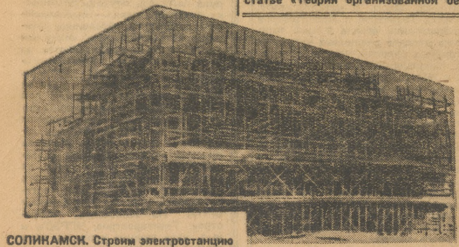
СОЛИКАМСК. Строим электростанцию

Собрание также требует принятия решительных мер против Сырцова и его друзей.