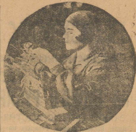
Златоуст, метзавод. Ударница-комсомолка коллектива им. XVI съезда за обмоткой мотора.

Слово получает Акинцев от ячейки цеха механических конструкций Уралмашинострой. Она первая выдвинула