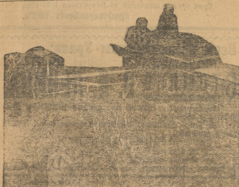
Молотят хлеб. Коммуна «Коминтерн» (Далматовский р-н).