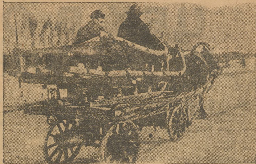
Готовятся к зиме.