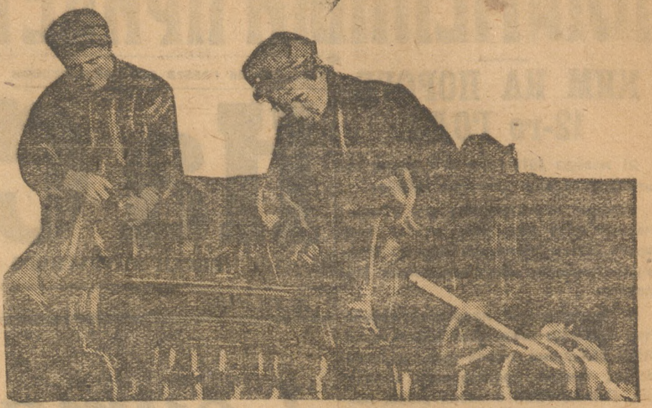
Ударники-слесари тюменской тракторной мастерской Райкопхозсоюза.