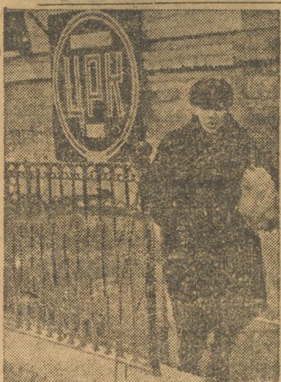
Закрывается типография «Гранит».