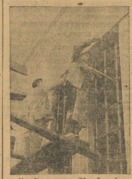
На Феррострове. (Челябинск).