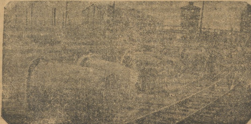
Надеждинск — пладбище металла.