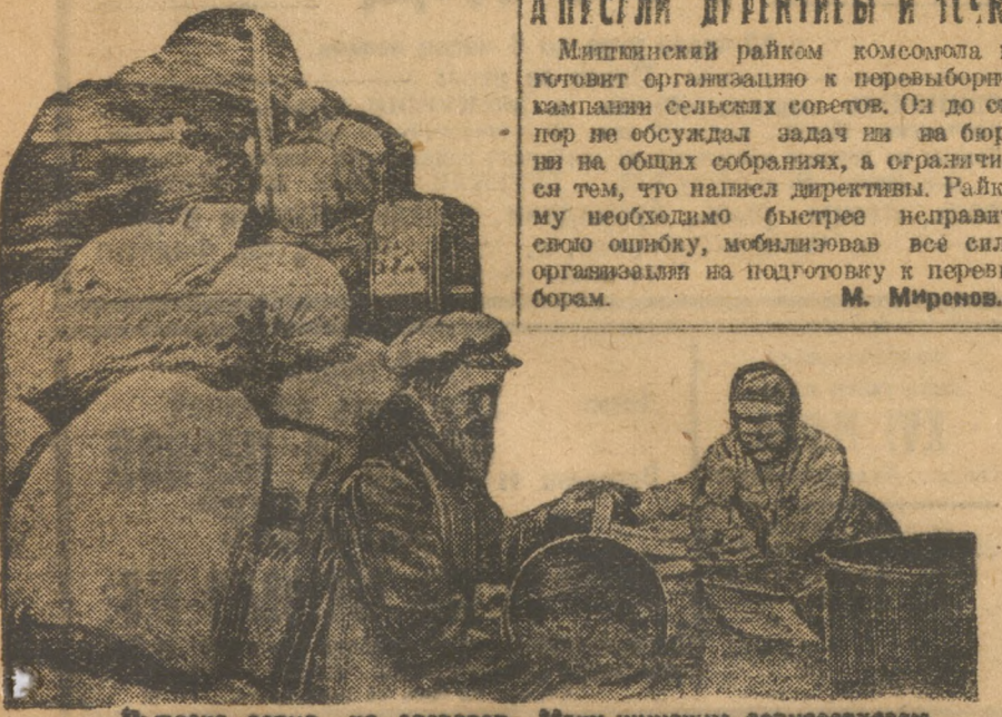
Возможа зерна на элеватор Макушинским зерносовхозом. На сыльном пункте Шадринского райколхозсоюза.

— Михайловский райлизбирком 24 октября провел районное разъяснительное инструктивное совещание сельских избиркомов.