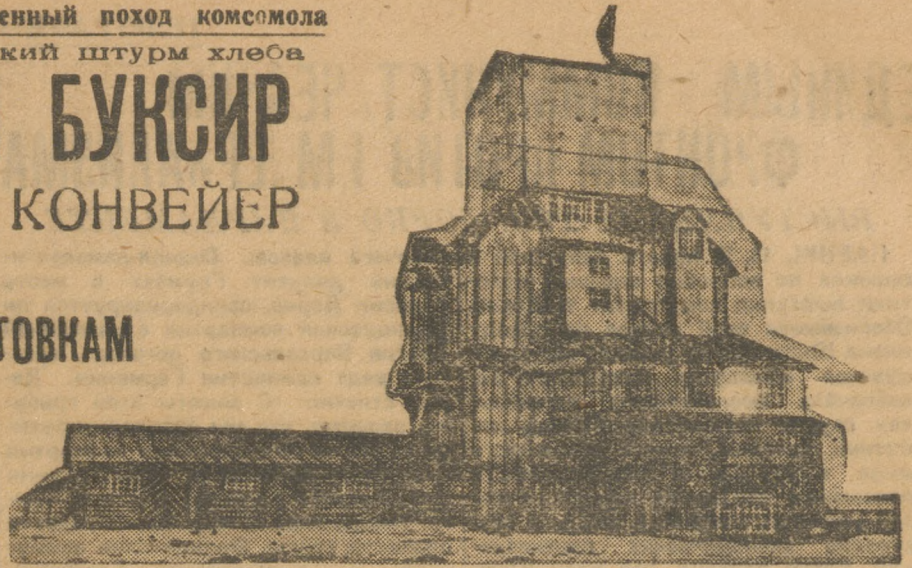
Элеватор при ст. Новая заимна.