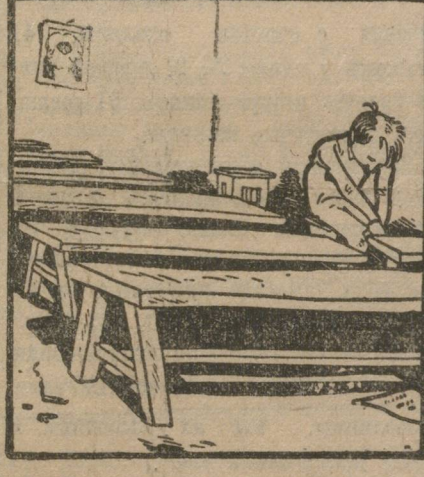
— Приступим к голосованию. — Кто за? — Единогласно.