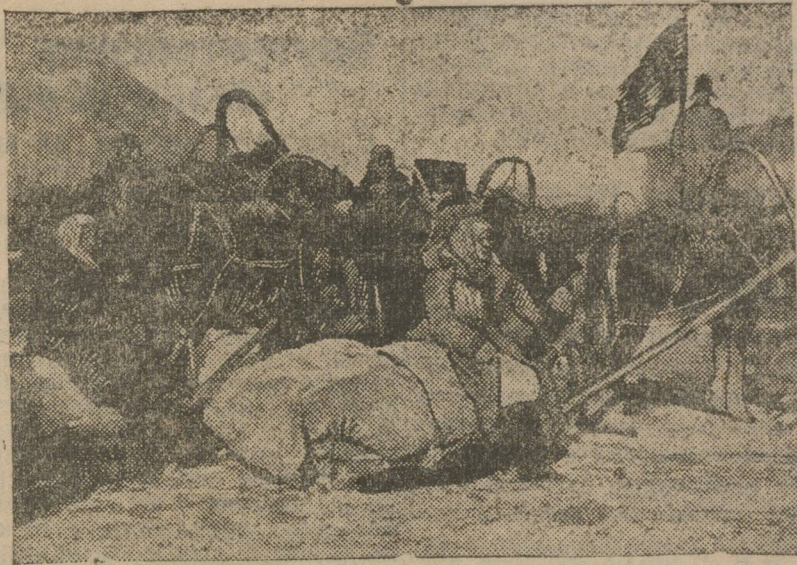
С КРАСНЫМ ЗНАМЕНОМ НА СЫПНОЙ ПУНКТ.