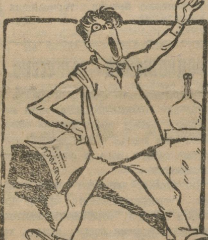
Слово для доклада предоставляется...