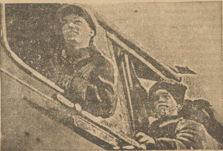
ЧЕЛЯБИНСК. Ударники тяжеловесной бригады.