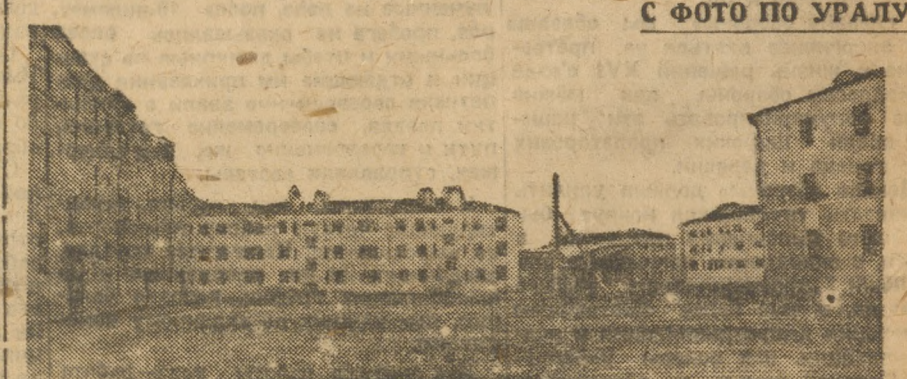
МОТОВИЛИХА. Рабочие дома законченные постройкой и XIII годовщине Октября.

Ячейка заверяет весь комсомол Урала через газ. «На Смену» о том, что она на 7-ю уральскую областную конференцию придет с молодежным цехом, с лучшими показателями его работы, с цехом молодых энтузиастов, который будет образцовым для всего завода... Собрание требует от лидеров правых Рыкова, Томского и Бухарина ясного большинства ответа: с кем они. ИВ. ЕГАРМИН.