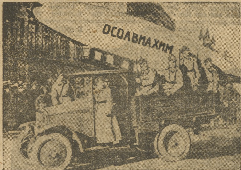
ОСОАВИАХИМ на октябрьской демонстрации в Свердловске.