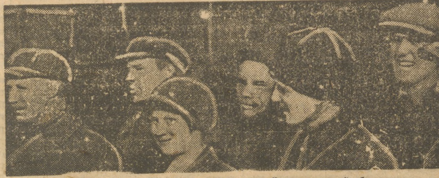
ЧЕЛЯБИНСК. Комсомольцы ударной паровозной бригады.

Местные организации—партийная, местком и административно-технический персонал паровозного цеха—упорно не хотят заниматься вопросом правильной расстановки сил и распределения ответственности за отдельные участки работы. Заседаний «говорилки» вокруг депо происходит больше, чем следовало бы, а конкретная работа по улучшению качества ремонта отсутствует. Не задалась еще этим вопросом и комсомольская ячейка. Со стороны административно-технического персонала замечается желание увильнуть от ответственности, а поэтому в цехе не существует «хозяев»-руководителей. Для примера приведем характерный эпизод