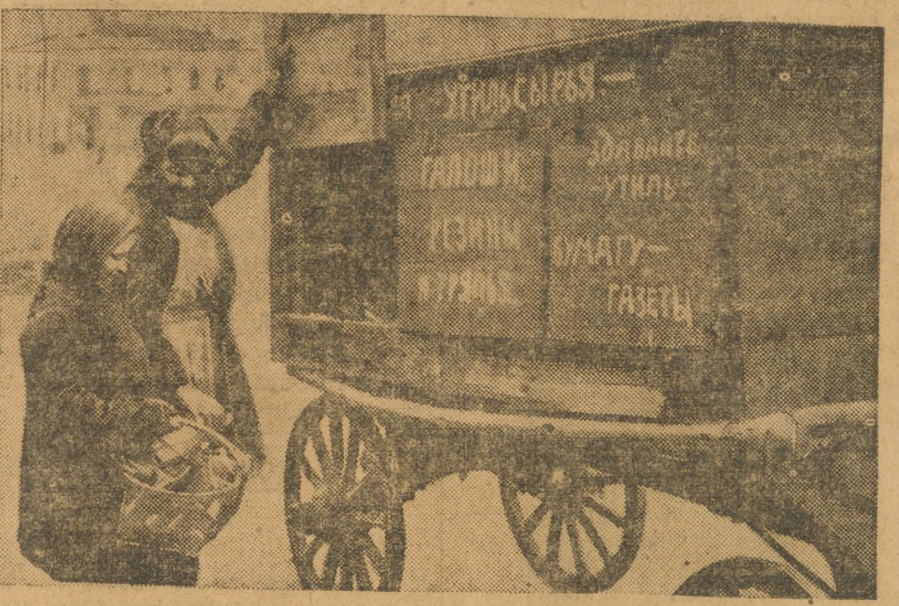
Повозка Уралторга для сбора утильсырья у населения.

стом месте среди других союзных республик. Колхозы и единоличники показывают почти одинаковый темп выполнения контрольных заданий. Комиссия ВЦИК в своем решении указала на то, что колхозники должны являться подлинными застрельщиками-организаторами займовской кампании.