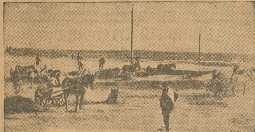
«Стальмост». Рытье котлована для плавного корпуса.