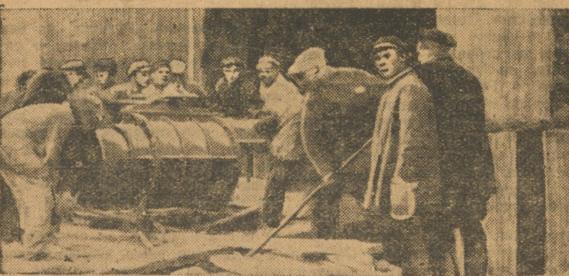
Уралмедстрой. Прибыло оборудован...

10. Особое внимание каждая организация в данной работе должна сосредоточить на еще большем развертывании социалистического соревнования и ударничества и развитии изобретательства, на мобилизации масс на полное выполнение заданий в ударный квартал и подготовке к новому хозяйственному году—третьему году пятилетки.