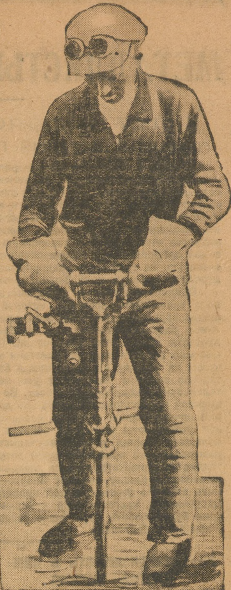
Гора Магнитная. Бурение...