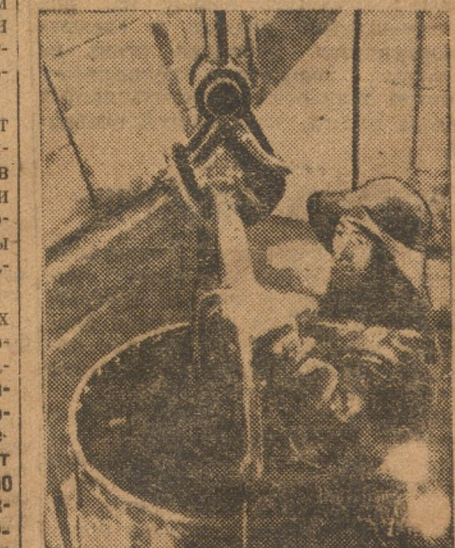
Служа в шахту им. Дзержинского (Кизел).