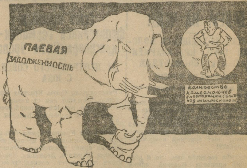
САМИ С РЕБЕНКА, А ПАЕВАЯ ЗАДОЛЖЕННОСТЬ СО СЛОНЕНКА.