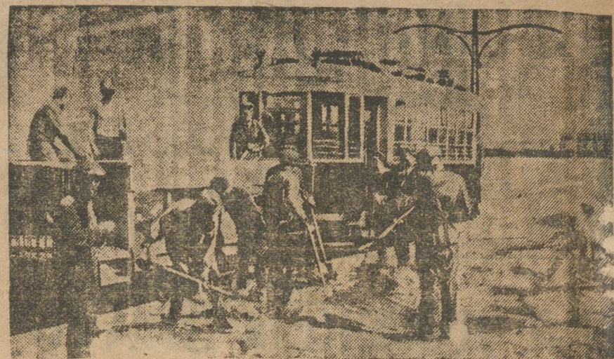
Прокладка второй трамвайной линии в Перми.

Если же финляндское правительство останется на позиции, изложенной в его ноте от 16 сентября, то союзное правительство вынуждено будет сделать вывод, что финляндское правительство не заинтересовано в поддержании добрососедских отношений с СССР.