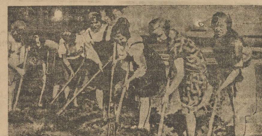
Комсомольцы Ново-Панченской ШКМ на уборке урожая овощей.

Сейчас начинается проводиться работа по сбору мешкотары среди населения. Кампания будет продолжаться по 25 включительно.