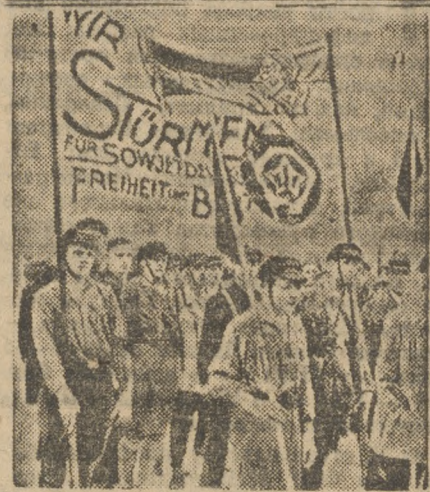
Комсомольцы демонстрируют за КПГ на улицах Берлина.

совавших за национал-социалистов. Розенберг считает важнейшей проблемой захват власти путем «мирного проникновения в госаппарат, а также насилия». Он призывает фашистов немедленно приступить к подготовительной работе, так как ситуация может измениться. Для ускорения перехода власти в руки фашистов Розенберг находит необходимым, чтобы в тех государственных учреждениях, где еще нельзя поставить у власти фашистов, были созданы уже теперь наряду с государственными органами, фашистские органы. На ряду с штурмовыми отрядами, Розенберг предлагает создать карательные батальоны для внезапных налетов, в первую очередь на революционные рабочие районы.