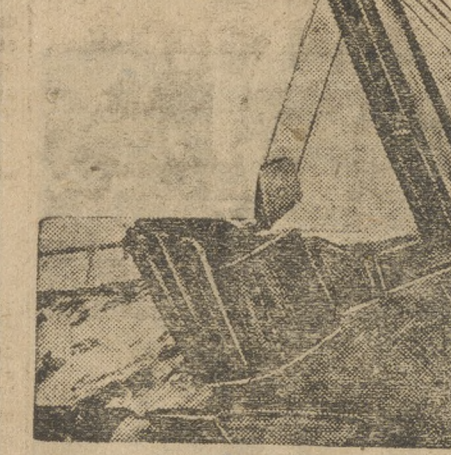
Гора Благодать. Экскаватор за работой.

Повседневное практическое оперативное руководство рудничным комитетом заменил резолютивной шумихой и разговорами «по поводу строительства социализма». Профсоюзники слушали, постановляли, но в жизнь своих хороших решений не проводили.