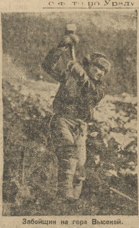
Забойщики на горе Высокой.