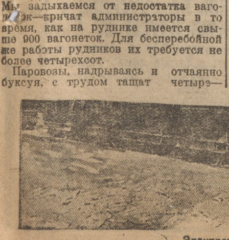
Электровоз на ВИЗЕ.

МОСКВА, 23. Несмотря на значительные темпы роста строительных работ в августе по сравнению с июлем, все же Магнитогорск со своим заданием не справился. Первая десятидневка сентября тоже не принесла решающей победы. На стройке электростанции котлованы надо было приготовить к 25 августа. Сроки прошли, котлованы не готовы. Бетонирование котлованов закончено лишь на 50%. Кирпичный зав. по вине администрации и технич. руководителя работает исключительно безобразно. Только один участок Магнитогорск — плотина имеет блестящую победу на строительном фронте. Рабочие и специалисты плотины показали, что они по-большевистски умеют бороться с трудностями, преодолевать их.