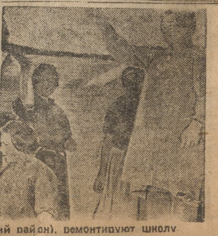
В коммуне им. Ленина (Узельский район), ремонтируют школы.