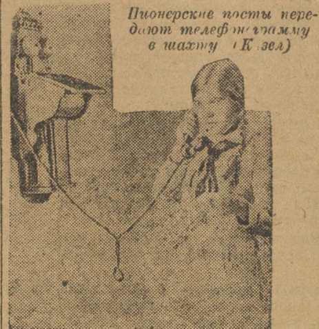
Пионерские посты переплетают телеграфную проволоку в шахте (К. Зел.)

Мы предлагаем установить между смежными участками и станциями взаимный контроль в работе путем