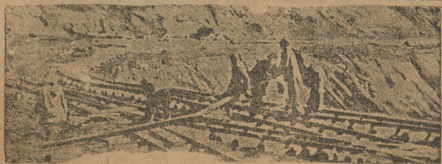
Г. ВЫСОКАЯ. Прокладка канатной дорожки.