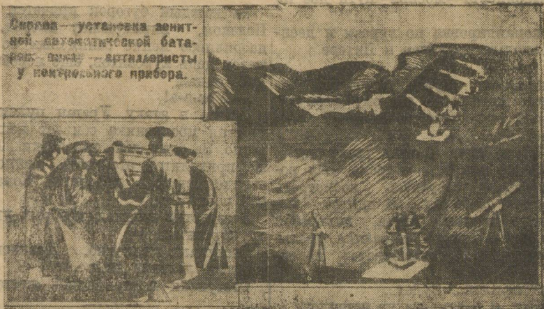
Слева — установка зенитной автоматической батареи. Справа — артиллеристы у переносного прибора.

В связи с ролью авиации в будущей войне, во всех армиях уделяют особое внимание развитию и усовершенствованию зенитной артиллерии. В этом направлении наиболее усиленная работа ведется в Северо-Американских Соединенных Штатах.