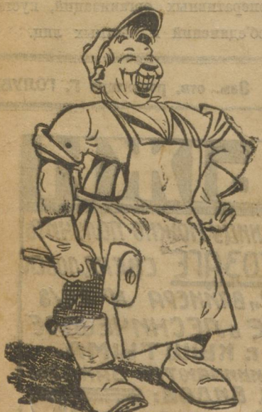
ФОТОГРАФИЯ, «СНЯТАЯ» СО СНЯ. ТОГО ФАБЗАЙЦА.

Не обижайтесь, дорогие фабзайцы. Подождите. Не пройдет каких-нибудь 10—15 лет, как этот мастер поставит вас на основную работу. А то, что он любит «снимать», так это, может, оттого, что он мастер только по профессии, а по призванию «моментальный фотограф». Надо понимать человека.