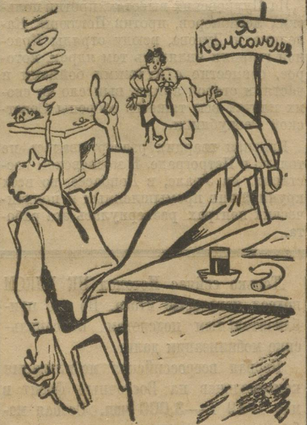
ОБРАЗЕЦ КАЗЕННОГО «БЛАГОПОЛУЧИЯ».

«Правда, влияло на их работу то, что ребята были много загружены другой работой»,—пишет тов. Овчин-