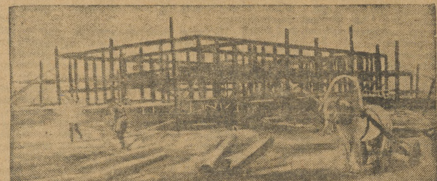
Совхозы растут. Строительство Ялано-Натайского совхоза. Постройка кооператива.