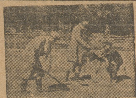
Сушка хлеба в коммуне «Новый Быт» (Богдан. р-н).

Фракции Уралпрофсовета и областными отделами союзов необходимо на деле организовать массовое шефство предприятий над колхозами, значительно расширить практику заключе-