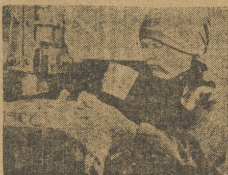
Лысвья, Ударница штамповочного цеха.