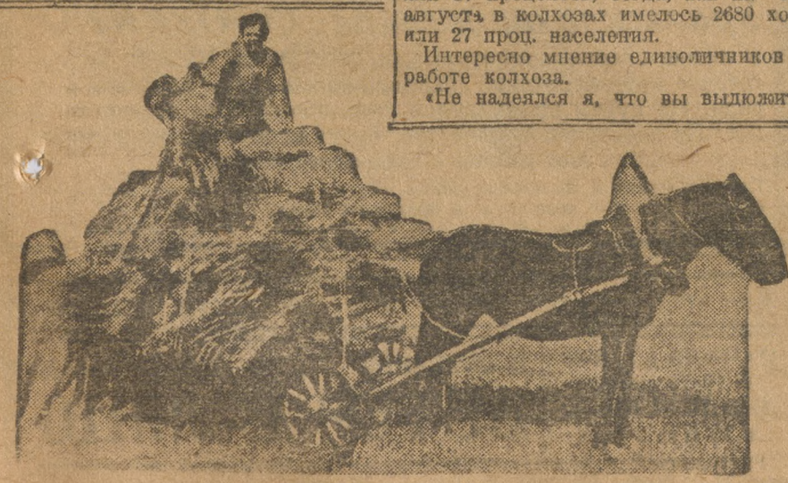
Уборка снопов в коммуне «Красные Орлы» (Куринский район).