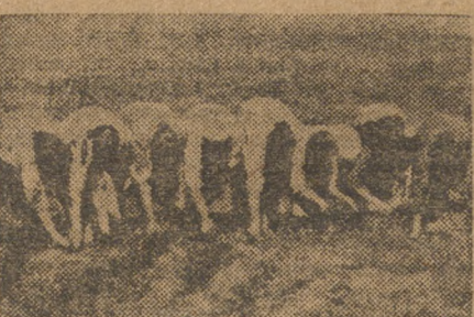
Дергают лен. (Чумлянский район).

В КУНГУРСКОМ РАЙОНЕ 1546 ГЕКТАРОВ ИЗ-ЗА НЕ УБОРКИ ЛЬНА ОБРЕЧЕНЫ НА ГИБЕЛЬ. Подобные сообщения поступают из ряда мест и все они говорят об одном: путь ко льну заставлен оппортунистическими рогатками, а партийные и комсомольские организации про лен забыли или делают вид, что им ничего не известно.