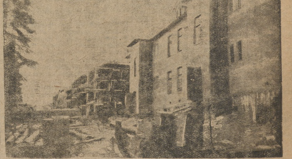
Новое жилстроительство в Кизеле