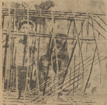
Цементной. Арматурщики за работой.