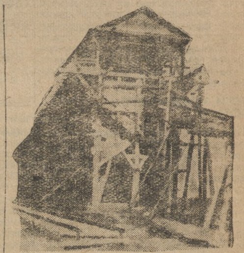
Высокогорские рудники. Бункера.

Выполнение обращения ЦК ВКП(б) должно сопровождаться усиленной борьбой с оппортунистами, особенно с правыми панкерами, не верящими в силы рабочего класса, и с левыми подпевалами.