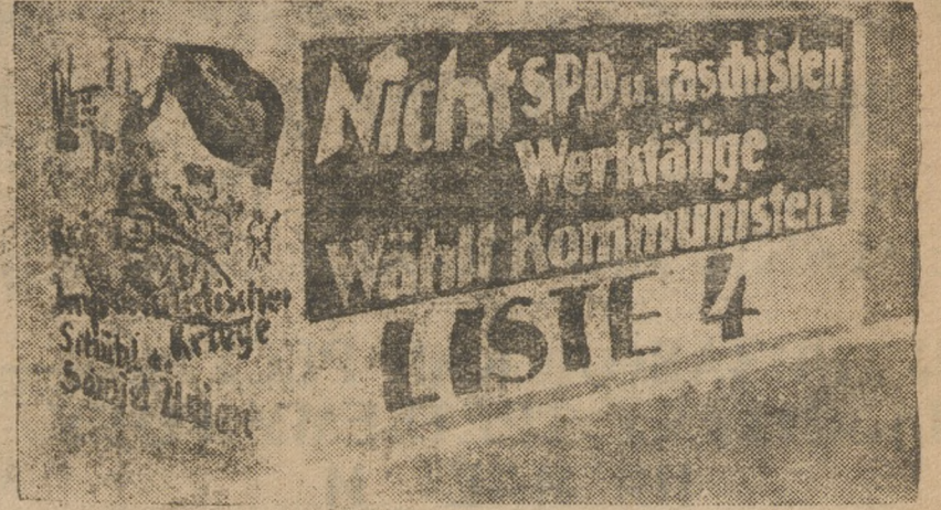
На снимке плакат компартии: «Не за социал-демократов, не за фашистов, а за список № 4—коммунистов, дол жеи голосовать каждый пролетарий! Война империалистической войне—все на защиту СССР!»