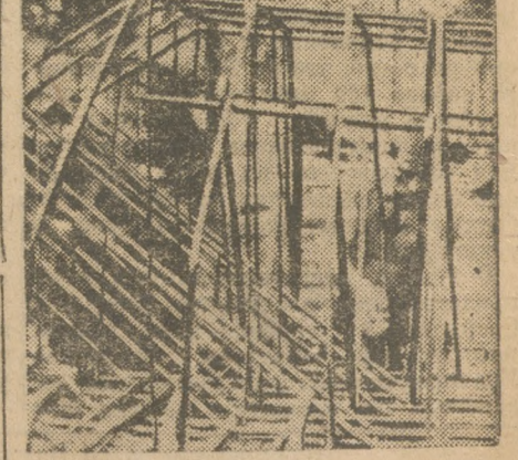
Цементной. Арматурщики за работой.