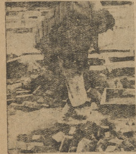
На постройке городка УПИ носильщики кирпича безобразно относятся к своей работе. Большая часть кирпича, сваленная таким образом с «нозья» негодна к употреблению.