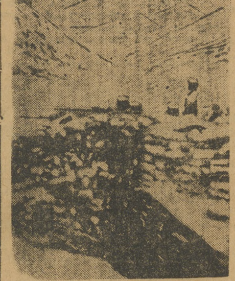
Сторожевой пункт англичан на Северо-Зап. границе Индии вблизи Пешавара, в районе в котором происходят бои между англичанами и афридидями.