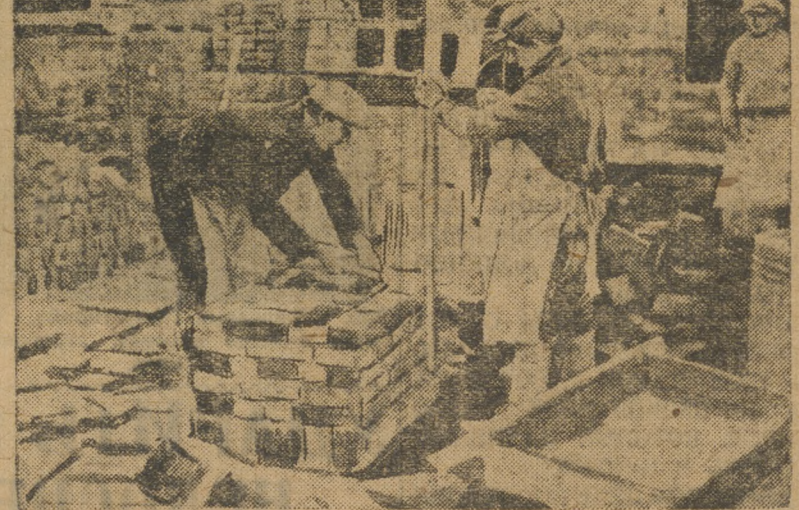
Ударная артель каменщиков-курсантов на кладке дома № 6 (7 участков).