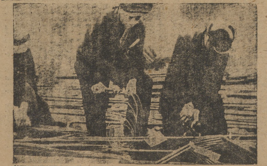
ЦЕМЕНТСТРОЙ Ударная бригада цитовцев - арматурщиков.

На ст. Златоуст создается угрожающее положение с разгрузкой вагонов с углем. В течение 3-х суток простояло 70 вагонов. Простой каждого вагона стоит 9 рублей, общий простой обошелся 630 руб. В ближайшее время должны прибыть 1000 вагонов в 16,394 тоннами угля. Рабочий силы нет.