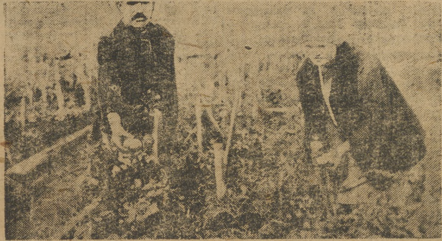
Уборка овощей в коммуне «Роза».

Завтра, 7 сентября Выходит специальный ШЕСТИПОЛОСНЫЙ НОМЕР „НА СМЕНУ“, посвященный XVI МЮДУ реbuyте во всех киосках и у газетчиков