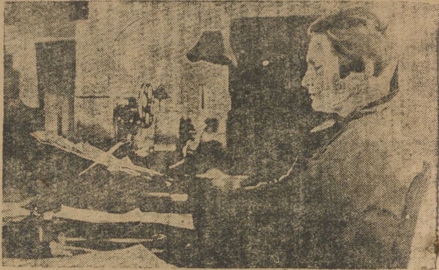
У аппарата «Бодо» на Свердловском телеграфе.