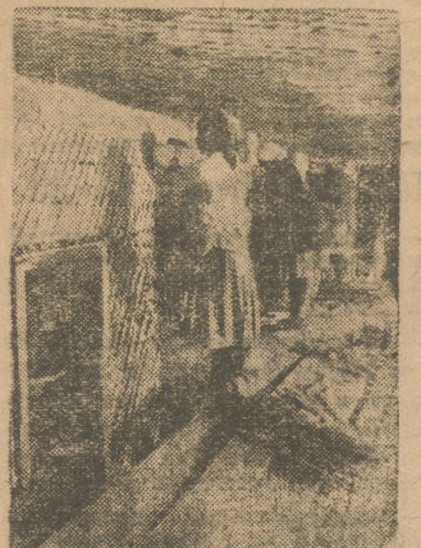
Штукатурные работы на постройке студенческого корпуса.