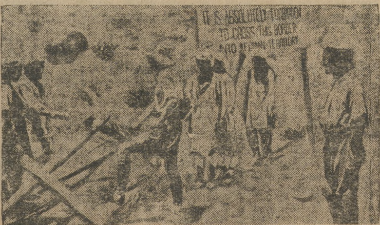
Граница Афганистана с Индией. Присходят упорные бои между воюющими афридиями и английскими войсками. На снимке: английский сторожевой отряд на афгано-индийской границе.