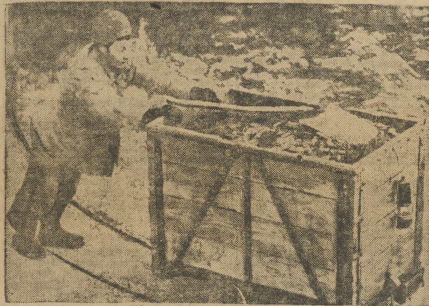
Шахты Кизела. Откатчики.

В связи с проработкой контрольных цифр нового операционного года, шахтеры организуют встречный промфинплан под лозунгом: «Увеличить программу добычи в ответ на оппортунистические пророчества с неизбежностью прорыва в первом квартале».