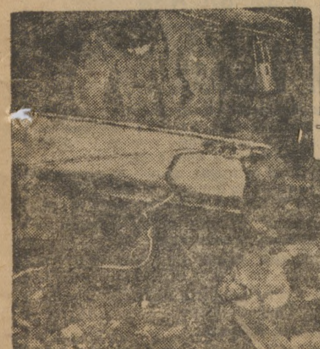
Шахты Кизела. Конвейерная подача угля из забоя

КОМСОМОЛЬСКИЕ ОРГАНИЗАЦИИ МЕТАЛЛУРГИЧЕСКОГО УРАЛА ДОЛЖНЫ ВКЛЮЧИТЬСЯ В ЖЕЛЕЗНЫЙ ПОХОД И ОКАЗАТЬ В ПОРЯДКЕ КОМСОМОЛЬСКОГО БУКСИРА ПОМОЩЬ КИЗЕЛОВСКОЙ ОРГАНИЗАЦИИ.