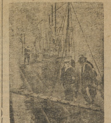
Советская подводная лодка в Копенгагене (Дания).