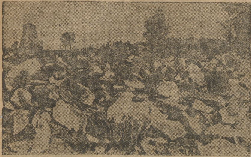
Индия руда ждет пусна Свердловского медеэлектротехнического завода.