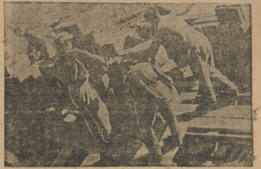
На строительстве Свердловского медеэлектролитного завода

— Крупнейший союз советгосслужащих должен реализовать 888 тыс., фактически на 20 августа реализовал только 480 тыс. — Контрольная цифра союзами рабпрос, медиков, рабес, СХЛР, напиг, печатников и швейников выполнена на 75,2 проц. В кассу Госбанка поступили первые взносы от ряда союзов в сумме 5.042 руб. — На зав. «Металлист» из 583 рабочих и служащих на заем подписались только 299 чел. Из 48.500 руб. реализовано лишь 16.185 руб. — Центральной сберкассой № 11 подписка принята от учреждений на 687 тыс., оформлена же только на 42.900 руб. — На Б.Исетском заводе из 3.506 членов союза подписались 2.611 на 127.870 руб. вместо 379.875 руб. — На УралВТУРешено из 8460 человек подписались лишь 760. Задание выполнено на 22 проц., охват 23 проц.