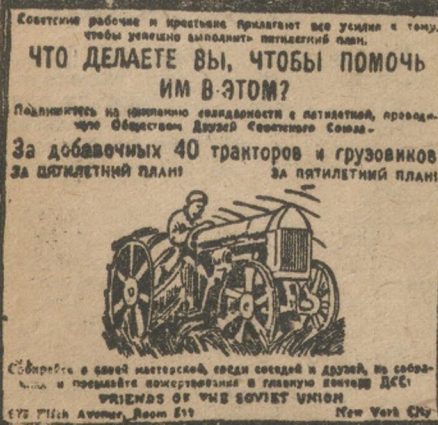
Плакаты общества друзей СССР, развешенный на улицах Нью-Йорка.

Бовая задача комсомола, опираясь на общественность, сломить косность и неверие практическим осуществлением лозунгов похода.