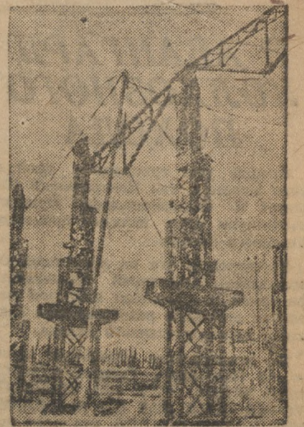
Уралмашинстрой. Подъем железных стропил на постройку чугуно-литейного цеха.