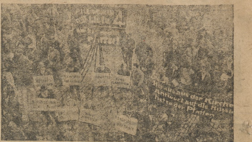
Предвыборная демонстрация пролетариев Берлица. В центре плакат, призывающий голосовать за список № 4 — список коммун. партии.

Косность, в бюрократизм преграждает путь мешка от крестьянского двора и элеватору. Эта линия, потупления урожая отводит под вредительский удар — зерно обрывает на та-