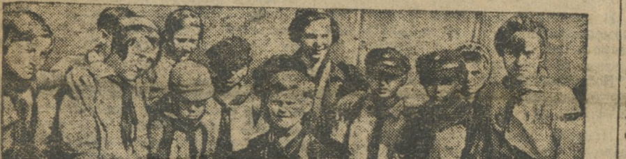
Группа иностранных пионеров.