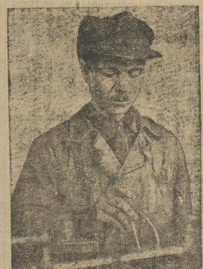
Лучший ударник механического цеха в Карабаше.