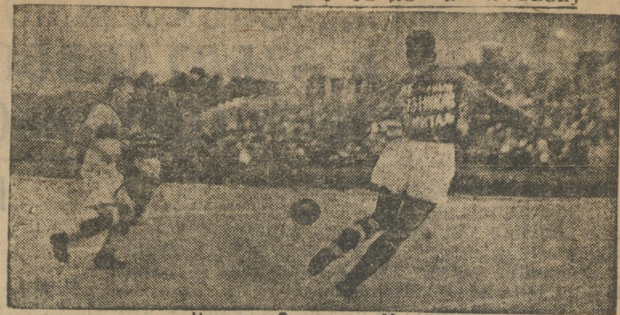
На матче Свердловск—Москва.

Находясь в Свердловске московские футболисты прибыли не только красиво «шить» футбол. Они, вместе с этим, приехали поделиться и своим опытом. После второго матча со сборной металлургов было созвано партийное совещание со свердловским активом, на котором москвичи поделились опытом своей работы и указали на исключительно слабую постановку всей физкультуры в Свердловске. Наш коллектив, — сказали в беседе с нашим сотрудником москвичи — состоит исключительно из рабочих — ударников. Видя колоссальные прорывы, которые имеет вся уральская физкультурность мы не смогли остаться в роли равнодушных наблюдателей и 14 августа вышли на субботник на Уралмашинстрой, где наглядно показывали как действует физическая культура на повышение производительности труда, дав вышесказанные нормы выработки в 116 проц. Работали мы на черных работах производя переноску и укладку кирпича. Мы вызываем всех физкультурников Урала отработать один день в фонд индустриализации — в фонд ликвидации прорыва. Каждый физкультурник должен участвовать в отработке, вне зависимости от участия в субботнике индустриализации. Мы ждем единодушного отклика от всех физкультурников Урала.