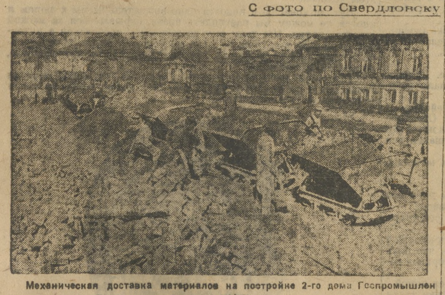
Механическая доставка материалов на постройке 2-го дома Госпромшленности.