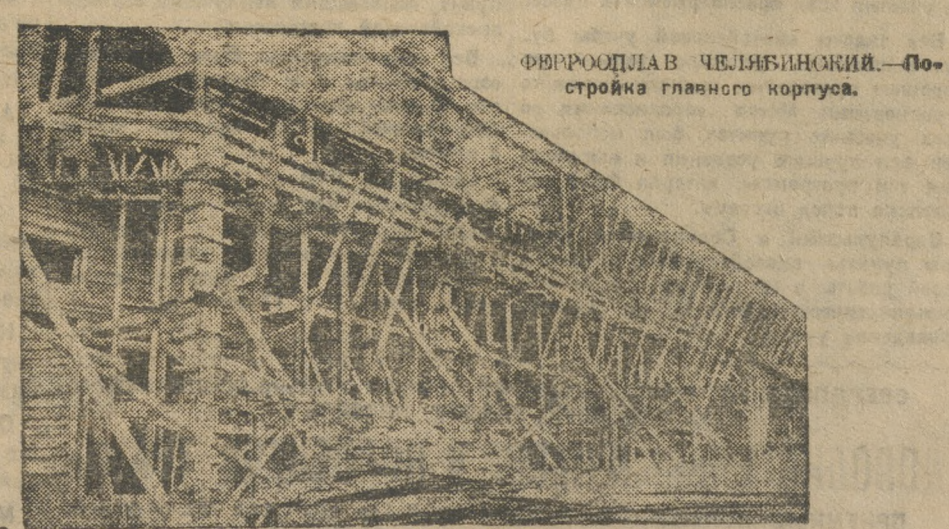
ФЕРРОСПЛАВ ЧЕЛЯБИНСКИЙ.—По-стройка главного корпуса.