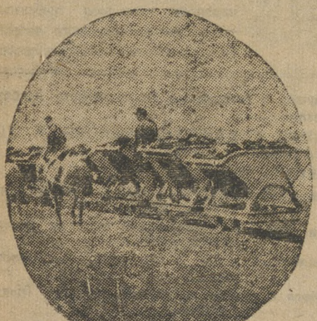
Земляные работы на Магнитострое.

Товарищи, работая молодежь! Учащиеся, студенты! Нет ли Утилиных и среди вас? Вышвырните их с учебы, чтобы не могли мерзавцы получать дипломы.