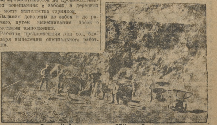
Разрез № 5 рудника им. ГПУ на Бакале.