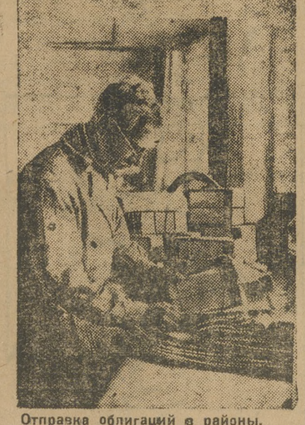
Отправка облигаций в районы.

Контрольная цифра по Свердловску по всем группам выполнена на 48,3 процента.