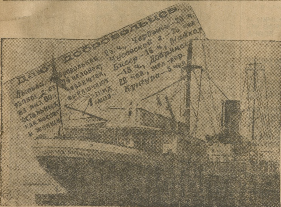
НА СНИМКАХ: 1. Сводка о мобилизации комсомольцев на польский фронт в 1920 году. 2. Суда на рейде.