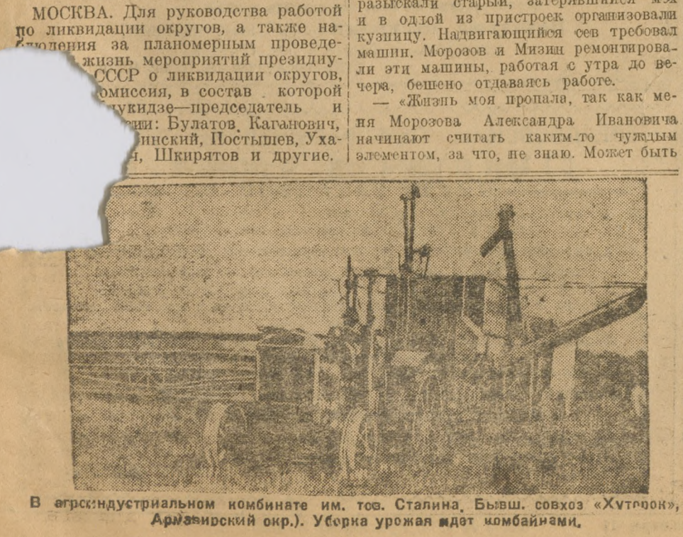
В агроиндустриальном комбинате им. тов. Сталина. Бывш. совхоз «Хутюк», Ардларский окр.). Уборка урожая идет комбайнами.