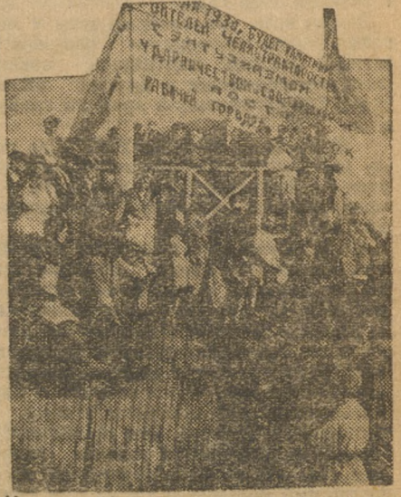
На закладке социалистического города на Челябинскострое.

Чтобы предотвратить срыв задания, дирекция дороги не должна давать в одно депо по несколько серий паровозов, а дать только две.