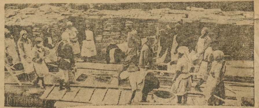
На строительстве гостиницы в Свердловске.