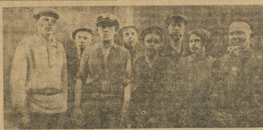
Группа комсомольцев «Монетки», подписавшихся на новый заем на сумму месячного оклада.

ВАРШАВА. На фабриках и заводах происходят массовки, на которых ораторы выступают с разъяснением значения антивоенного дня. Буржуазная печать надеется, что польской полиция удастся не допустить рабочих к выступлениям 1 августа.