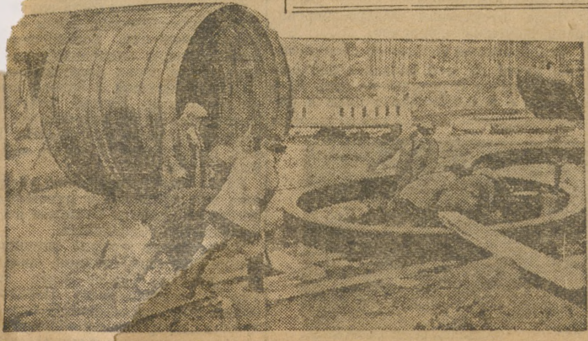
Монтаж импортного оборудования на суходолском строительстве.