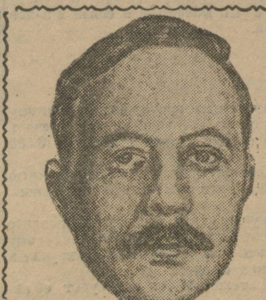
Арест Андре Марти

— Не следует обострять экономических проблем; надо всем вместе идти по пути «мира в промышленности».