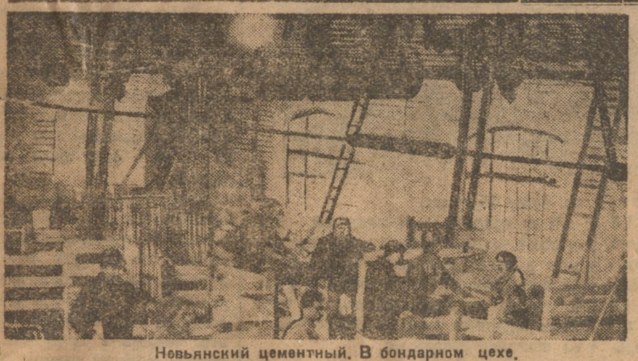
Новьянский цементный. В бондарном цехе.

ПРОЧТИТЕ: — Укрепить транспорт— Собачья старость. (1 стр.) — Доклад тов. Сталина на XVI съезде ВКП(б) (2—3 стр.) — Уральская эстафета в Нижнем.— Ни одного убитого в спине.— Испания накануне всеобщей забастовки (4 стр.).