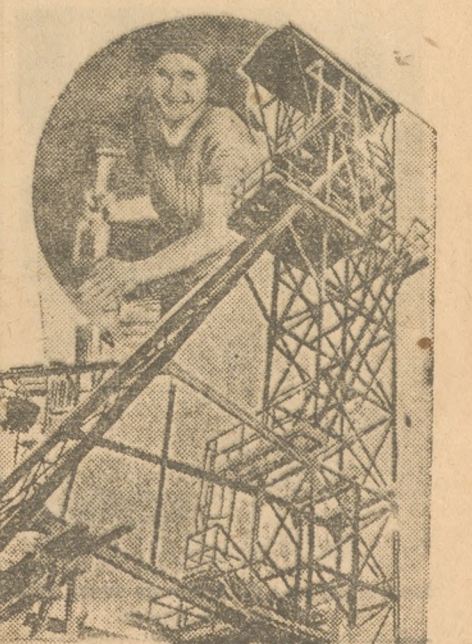
Новые кадры на строительстве.