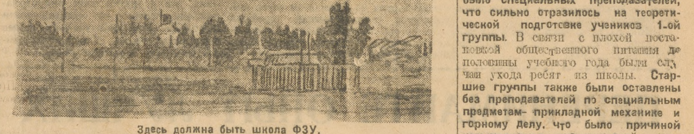
Здесь должна быть школа ФЗУ.